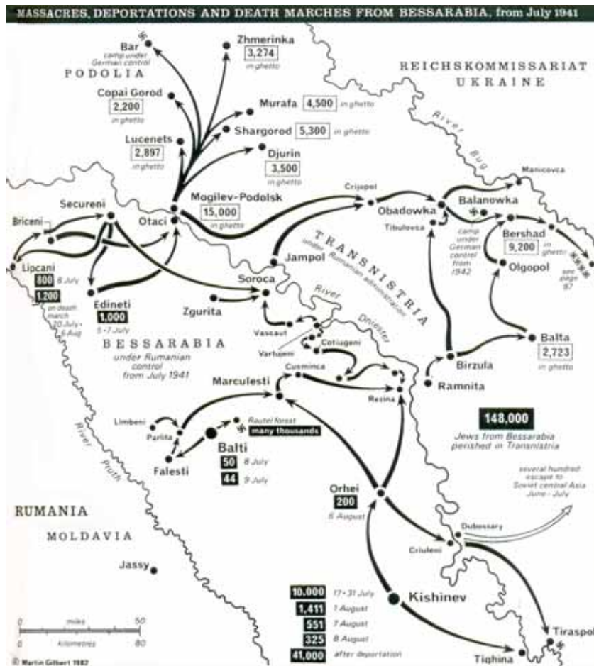
Вбивства, депортації та «марші смерті» з теренів Бессарабії в липні 1941 року