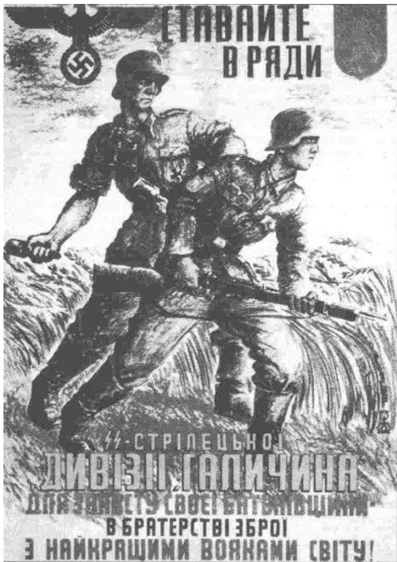
Стрілецька дивізія «Галичина» (м. Львів, 1943 р.)