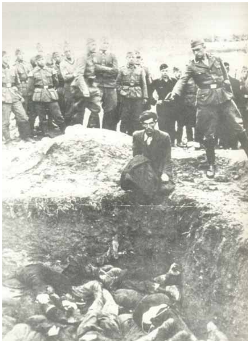
За хвилину до загибелі (м. Вінниця, 1941 р.)