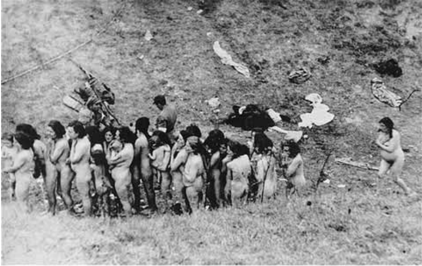
Голі єврейські жінки. Деякі з них тримають на руках дітей. Вишукувались у лінію, чекають розстрілу, здійсненого колаборантами

Важливим фактором соціально-політичного життя, який не можна недооцінювати, є наявність у той період політичної культури, як радянських ідеологів, так і проводів, ідеологів ОУН(б), особливо думки останніх, що німецько-радянська війна стане поштовхом до української революції, тактичних підходів до розв'язання політичних, державницьких проблем, зокрема пропагандистського трактування євреїв як «жидокомуни», тобто опори більшовизму в Україні.