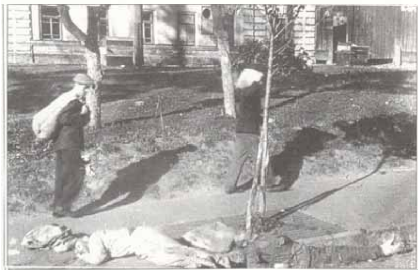
Перехожі оминають розстріляних на вулиці Жиланській. Жовтень 1941 р.