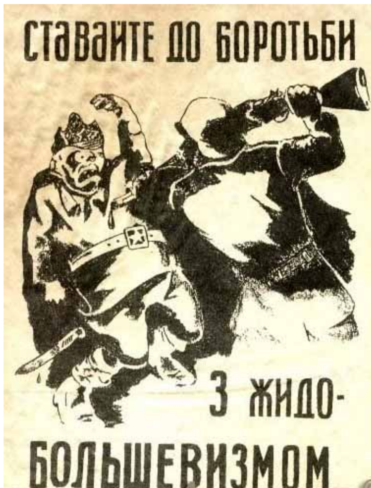
Один з численних антисемітських плакатів, що розповсюджувалися на території окупованої України

В історичній літературі, історичній пам'яті це відбилося в різних надуманих і ненадуманих звинуваченнях, стереотипах українського генетичного антисемітизму, єврейського більшовизму, які певною мірою вплинули на події Голокосту та їхнє наступне усвідомлення і осмислення.