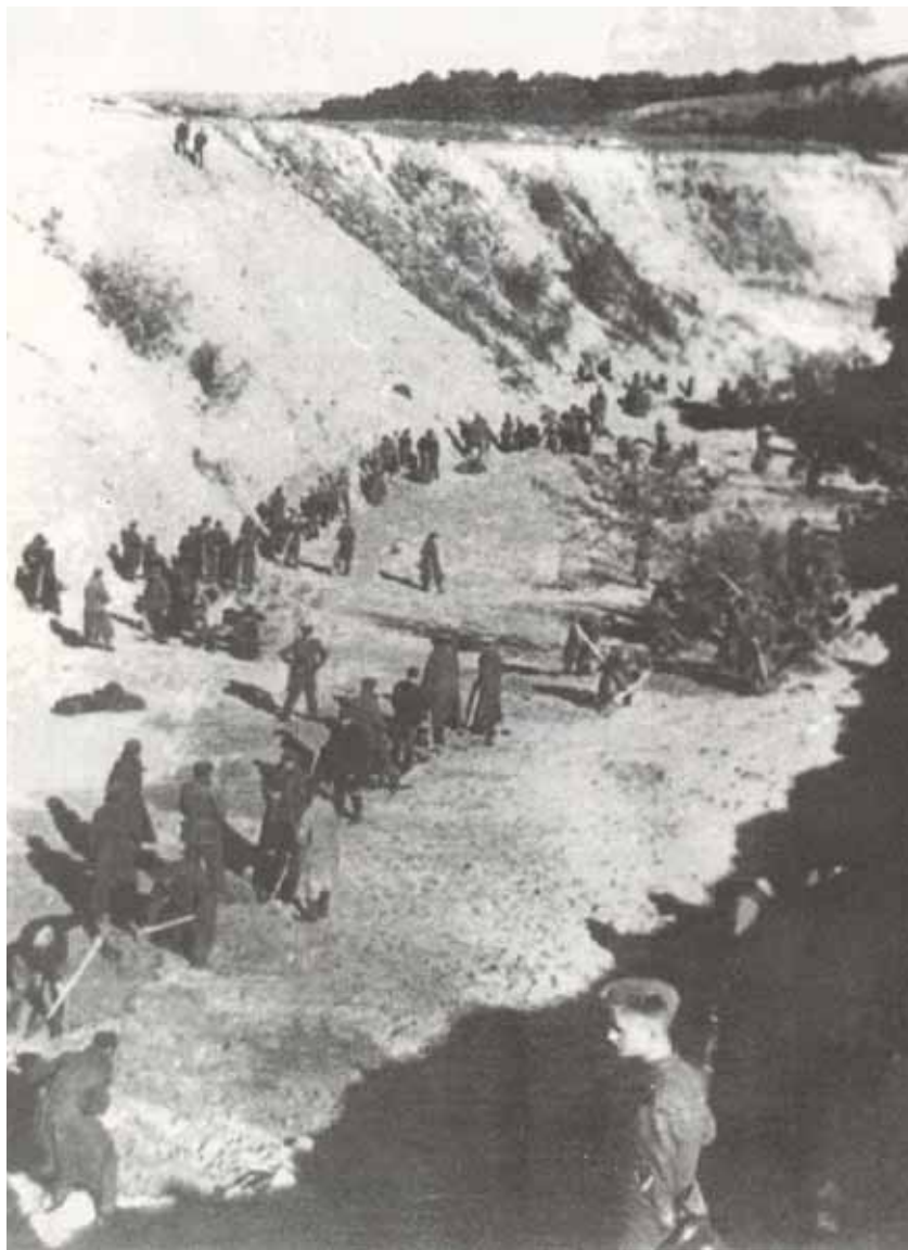
Бабин Яр після масових розстрілів. Жовтень 1941 р.