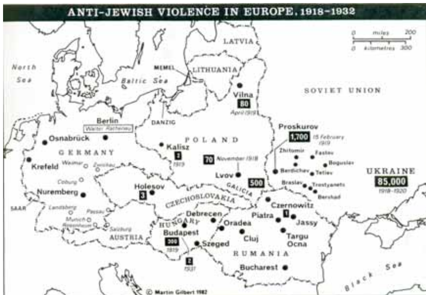
Антиєврейські виступи у Східній Європі (1918–1932 роки)