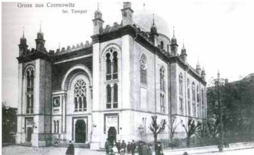
Єврейська синагога в місті Чернівці