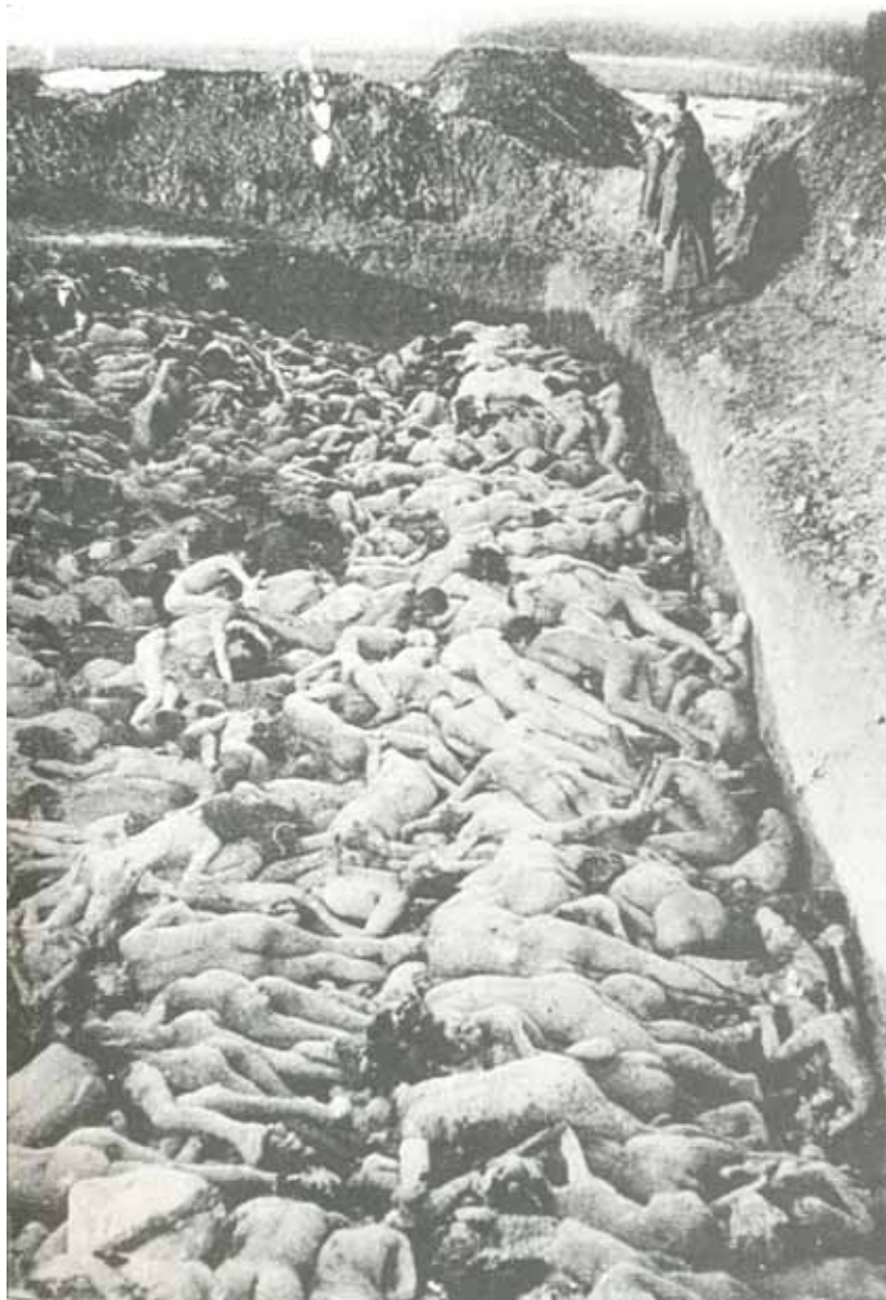
Масовий розстріл євреїв міста Мізоч (Волинська обл.)