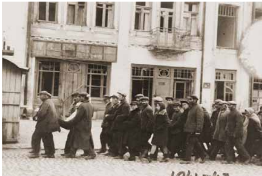
Депортація євреїв з м. Кам'янець-Подільського на розстріл за межі міста

14 жовтня 1942 року єврейських жінок і дітей з гетто Мізоч розстріляли в Яру, неподалік від Рівне, розстріл робили німці з допомогою української поліції.