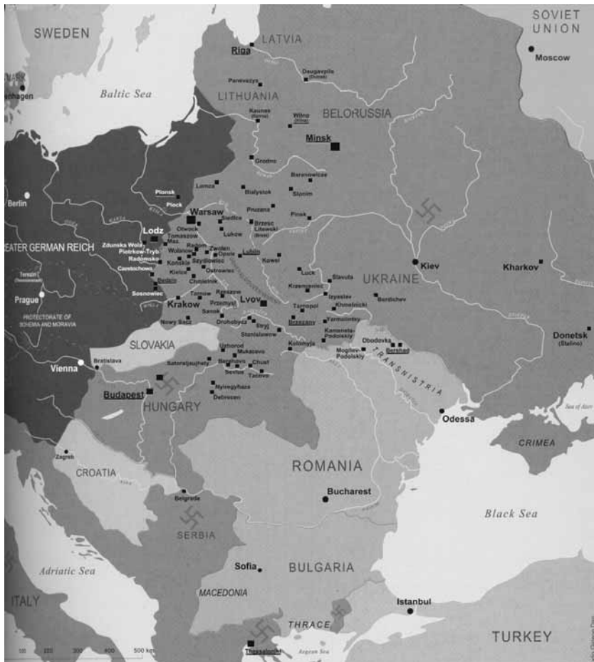
Гетто на території Східної Європи 1941–1944 рр.

рах отримала назву «Райнхард». Це було ім'я Гайдріха, одного з нацистських керівників, що відповідав за знищення європейських євреїв. Його було забито бійцями чеського Руху Опору в травні 1942 року. Багато львівських євреїв загинули саме в таборі Белжець. Перша депортація зі Львова до Белжеца відбулася 17–19 березня 1942 року... Загалом в роки Голокосту в цих трьох нацистських таборах смерті на території Польщі було знищено приблизно 1 600 000 євреїв з різних країн Європи.