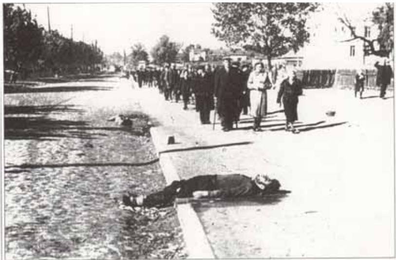
Застрелені чоловіки на бульварі Т. Шевченка, біля Промакадемії. Жовтень 1941 р.