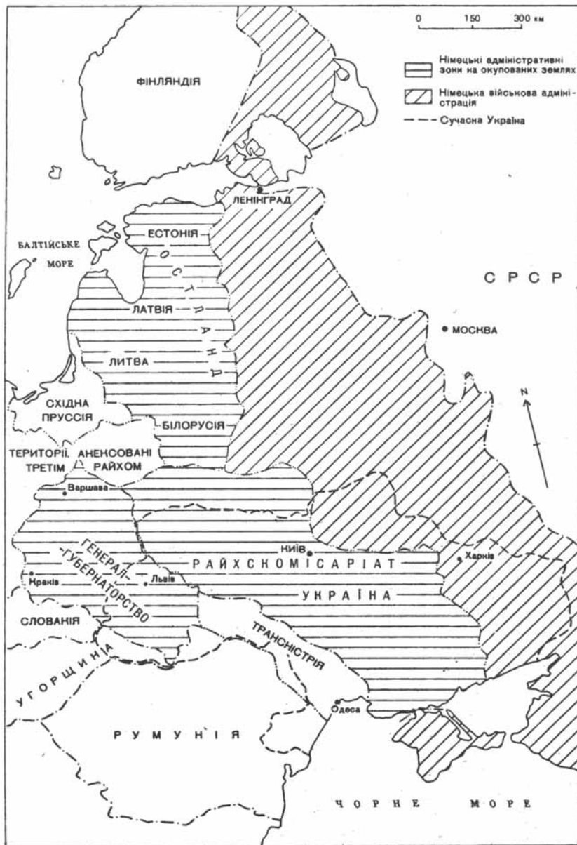
Нацистський поділ теренів України, кордони Райхскомісаріату «Україна»