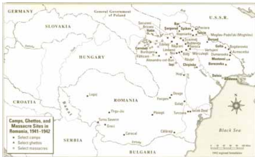
Місця розташування робочих таборів, гетто та масових вбивств у Румунії в 1941–1942 рр.

У серпні 1941 року на теренах Буковини були створені концтраційні табори для євреїв. З інформаційного бюлетеня Чернівецького інспектората поліції, надісланого губернаторству Буковини і військовому командуванню про кількість висланих у концтабори станом на 24 серпня 1941 р.: «...Відомості по таборах: Чернівці –