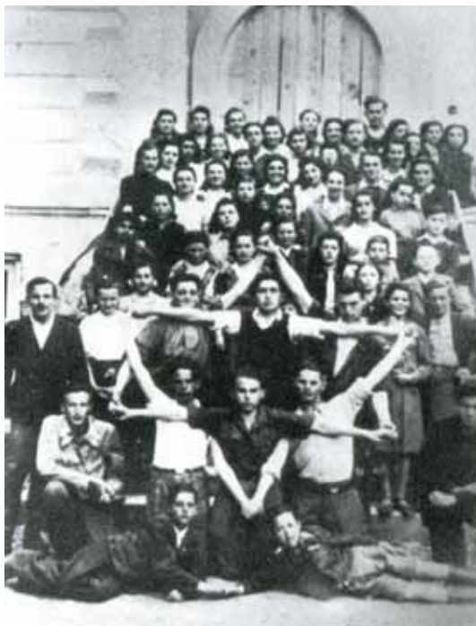
Група «Гехалуц». Єврейська молодіжна організація

Після війни Україна не зуміла вибороти державну незалежність і, як наслідок, була поділена між різними країнами: західноукраїнські землі опинилися у складі трьох країн: Румунії, Чехословаччини та Польщі, це були відповідно такі території, як Буковина, Закарпаття та Галичина і Волинь. На цих землях були великі єврейські