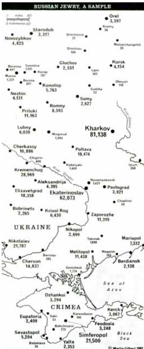
Статистика чисельності єврейського населення напередодні війни на території Східної України та Криму