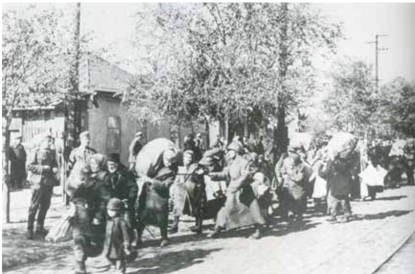
Депортація євреїв з Бессарабії і Буковини до Трансністрії

кої та західні райони Миколаївської областей, а також землі Бессарабії (сучасна Молдова), які знаходились за Дністром (Рибніца, Дубосари, Тирасполь та ін.) — загалом 40 тис. км 2 . Ця територія була перетворена на румунське губернаторство «Трансністрія». Офіційно про створення Трансністрії було оголошено румунами 17 жовтня 1941 року. Цивільним губернатором Трансністрії Антонеску призначив професора Алексяну.