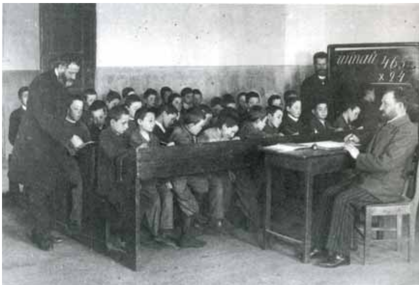
Під час уроку в єврейській школі

У 1920–1930-х роках єврейські громади на західноукраїнських землях розвивалися загалом добре, розвивалися освіта, говорили в основному рідною мовою — мовою їдиш, також польською, менше угорською, румунською, чеською; посилювався сіоністський рух, євреї брали активну участь у політичному житті цих країн, традиційне релігійне життя також мало своє місце. Синагоги, єврейські молитовні дома були скрізь і у великій кількості. Відомими єврейськими політичними діячами того часу були Натан Бірнбаум, Ру-