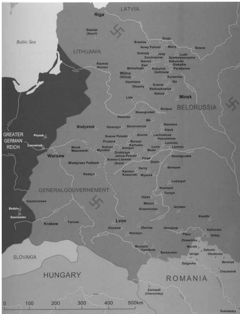
Повстання в гетто на окупованій території СРСР, включаючи Україну