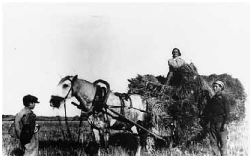
Єврейська родина збирає сіно з поля і завантажує у свій віз

У 1920–1930-х роках євреї на теренах Східної (Радянської) України перестали жити обшинним життям, єврейські громади фактично припинили своє існування, тоталітарний режим зробив євреїв, як і інших, частиною так званого «радянського народу». Релігійне життя влада заборонила, поступово єврейські родини відходили від звичаїв свого народу, синагоги майже всі закривалися. Але все-таки, незважаючи на таку політику влади, єврейське населення Східної України продовжувало жити і намагалося зберігати свої національні традиції та водночас пристосовувалося до загального життя населення Радянської України. Влада дозволила здобувати освіту на мові їдиш, існувало багато єврейських шкіл, в яких навчання здійснювалося цією мовою, але під жорстким контролем влади; на жаль, у другій половині 1930-х років їх почали масово закривати. У цей період багато євреїв переселилися з маленьких містечок до великих міст і там робили свою кар'єру. У середині 1930-х років серед євреїв Східної України було багато лікарів, інженерів, учителів тощо. Головними містами, де жили євреї, були Київ, Одеса, Дніпропетровськ, Харків. У Східній Україні в цей період було багато талановитих єврейських письменників, які писали мовою їдиш: Давід Бергельсон, Перец Маркіш, Давід Гофштейн та ін.