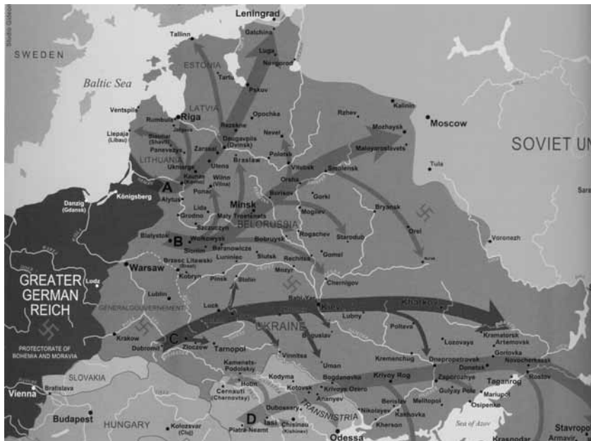
Злочинний шлях айнзацгруп А, В, С і D на окупованій радянській території