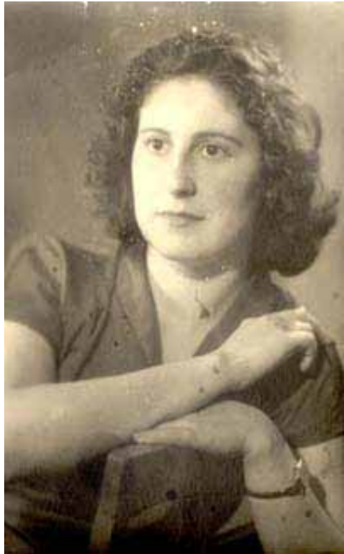
Праведник народів світу Тетяна Зеленська

У добу Голокосту на українських землях була, як казав відомий філософ і політолог Цветан Тодоров, ситуація екстрими, повного напруження сил людей, що опинилися в немилосердній, абсолютно жорсткій ситуації нацистської, безжалісної до всіх, антилюдської за суттю, окупації. Але щодо євреїв нацистська окупація була найжахливішою, коли вони були поставлені в умови тотального переслідування та відкритого вбивства. У таких умовах, коли в усіх без винятку країнах Європи, де були нацисти, писали в газетах, попереджували в об'явах і т. ін., що будь-яка допомога чи рятування єврея, єврейської жінки, дитини, старої людини буде каратися миттєво і тільки в один спосіб — смертю... Ані в'язницею, ані концтабором, ані грошима, ані чим іншим, а тільки смертю... У такій екстремальній ситуації неєвреї, які вирішували рятувати євреїв, ховати їх у себе, робити фальшиві документи, приносити їжу, сприяти втечі з гетто чи з табору тощо, такі люди в тих умовах мали особливий склад душі, співчуття до чужих обставин, до чужої трагедії, вони були просто героями, тому світ їх і називає Праведниками народів світу . За даними Музею Яд Вашем з Єрусалиму, який