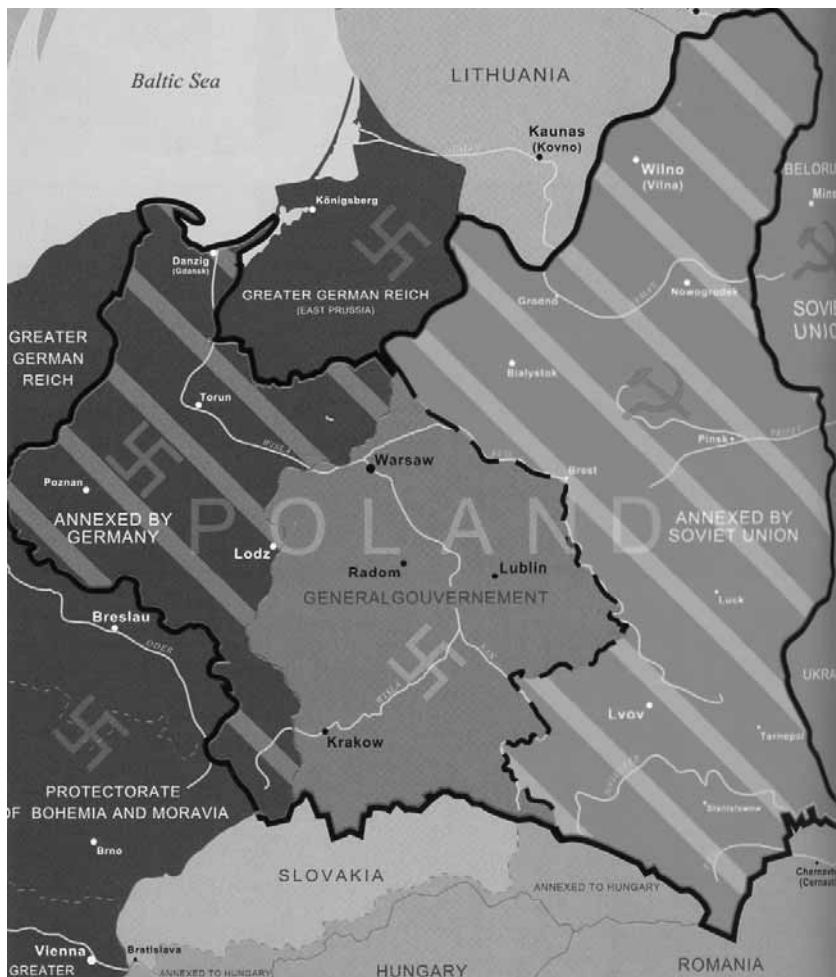
Розподіл теренів Польщі між Німеччиною і СРСР, 1939 р.

Протягом цих двох років (з 1939 по 1941) західноукраїнські землі* , в яких основним населенням були три народи: поляки, євреї, українці,