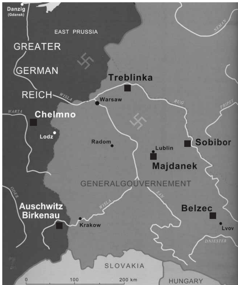
Табори смерті на теренах польського Генерал-губернаторства 1942–1943 рр.

У серпні 1942 року відбулася найбільша гітлерівська «акція» знищення львівських євреїв. Протягом першої половини серпня 1942 року було замордовано 55 000 чоловік. Майже всі вони були відправлені до газових камер Белжеца. Дуже незначна частина з них була