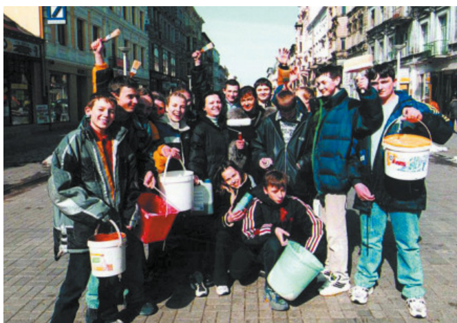
A feliratokat lemosó fiatalok csapata Lódzban (Lengyelország)

A tavasz első napjaiban több száz fiatal járja Lódz utcáit azzal a céllal, hogy kifejezze, nem ért egyet a köztereken – házfalakon és aluljárókban – megjelenő, a kisebbségekre vonatkozó, sértő feliratokkal. Az UNESCO kezdeményezésére március 21. az Antirasszizmus Napja. Ezen a napon minden évben Lódz lakosai – fiatalok és idősek – kefékkel és ecsetekkel felszerelve elindulnak, hogy megtisztítsák városukat a gyűlölet kifejezéseitől.