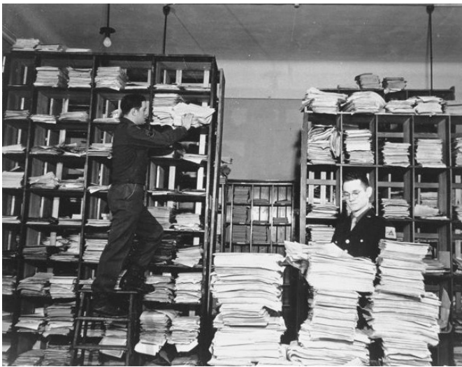
Amerikai katonák rendezik a nürnbergi perben bizonyítékként összegyűjtött iratokat

A második világháború után a népiértésért felelős bűnösöket Nürnbergben bíróság elé állították. A vádlottakat emberiség ellen elkövetett és háborús bűncselekményekben találta bűnösnek a nemzetközi bíróság. A pert továbbiak is követték, ahol elítélték a náci népiértés kitervelőit és végrehajtóit. A náciizmus veresége óta számos nemzetközi egyezmény és nemzetközi szervezet született az emberi jogok tiszteletben tartásának biztosítására, a népiértés megakadályozására, valamint az emberiség elleni bűntettek megbüntetésére.