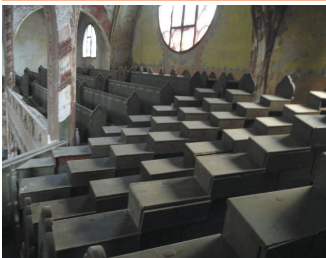
A szabadkai zsinagóga mára elhagyatott belső tere. A híveket a nácik és cinkosaik előpusztították.

Ezt az alkalmat használták ki Lengyelországban egy antiszemita kampány elindítására: a Lengyelországban élő zsidókat azzal vádolták meg, hogy a kommunista kormánnyal szemben ők Izraellel szimpatizálnak. A zsidó származású politikusokat hibáztatták az ország rossz gazdasági helyzetéért is. 1968 márciusában a gazdasági nehézségek hatására a diákok kormányellenes tüntetéseket szerveztek szerte az országban, és mivel néhány zsidó származású diák is a szervezők között volt, a tüntetések kirobbantásáért is a zsidókat tették felelőssé. Az „anticionista” kampány következményeként sok zsidó ember vesztette el állását Lengyelországban, és sokakat emigrációra kényszerítettek.