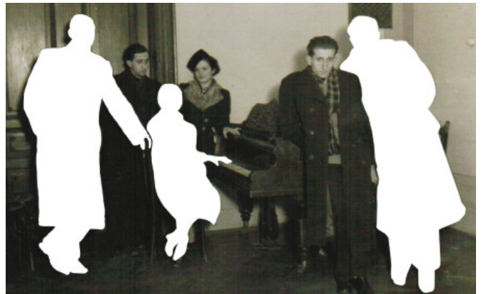
A társaság 1945 után életben maradt tagjai