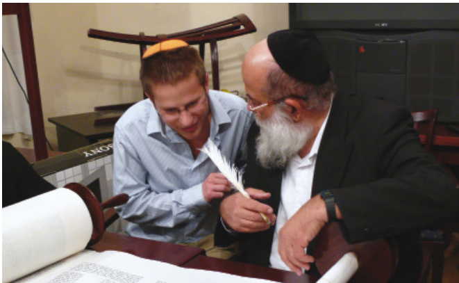
Tóráiró Budapesten, 2011-ben

A holokauszt után a túlélők egy része Európában maradt és igyekezett újrakezdeni az életét. Nyugat-Európában lassan újjászerveződtek a zsidó közösségek, kinyitottak a zsinagógák és a zsidó iskolák. Kelet-Európában a zsidó kulturális és vallási élet csak a kommunista rendszerek bukása után éledhetett újjá. Az antiszemitizmus azonban nem tűnt el, újra és újra felbukkan Európában. Egyesek még azt is kétségbe vonják, hogy a holokauszt valóban megtörtént.