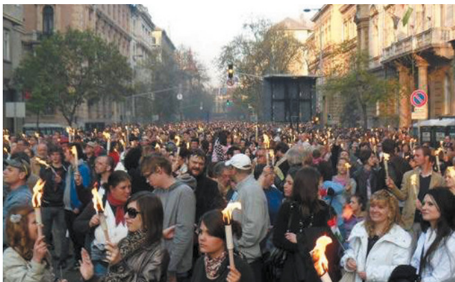
A budapesti Élet Menete a holokauszt emléknapon 2011-ben

„Aki nagy nyilvánosság előtt a nemzeti szocialista és kommunista rendszerek által elkövetett népirtás és más, emberiség elleni cselekmények tényét tagadja, kétségbe vonja vagy jelentéktelen színben tünteti fel, büntetést követ el, és három évig terjedő szabadságvesztéssel büntetendő.” (A nemzetiszocialista és kommunista rendszerek bűneinek nyilvános tagadásáról szóló 269/C. törvénycikk, melyet az Országgyűlés 2010. június 8-án fogadott el.)