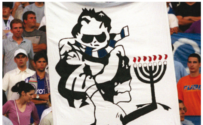
Antiszemita transzparens az FTC-UTE mérkőzésen 2001-ben, Budapesten.

„6. Tilos a stadion területére bevinni gyűlölet keltésére alkalmas feliratot, zászlót, a jogszabály által önkényuralmi jelképnek minősülő tárgyat, eszközt. 7. Tilos bármely népcsoport, nemzet gyalázása, becsmérése, vallási, faji, politikai hovatartozás és egyéb szempontok szerinti megkülönböztetése: zsidózás, cigányozás (csoportos és egyedi bekiabálások), huhogás, színes bőrű sportolók gúnyolása.”