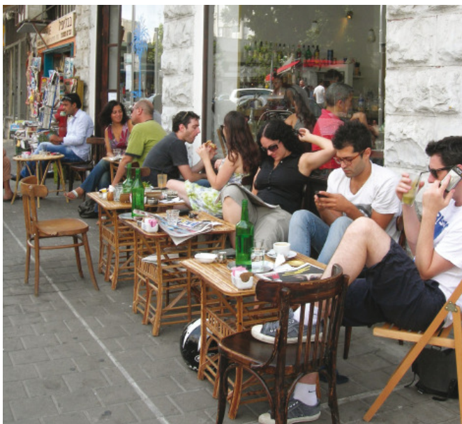
Izraeli fiatalok napjainkban

Az arab államok és Izrael közötti háborúknak a világ más részein élő zsidók életére is közvetlen hatása volt. Számos arab országban érte a zsidókat fenyegetés és támadás, emiatt ezekből az országokból több mint félmillió zsidó menekült Izraelbe. Korábban egymillió zsidó élt Észak-Afrikában és a Közel-Keleten. Számuk az 1970-es évekre mindössze harmincezerre zsugorodott. Az Izraelbe érkezettek állampolgárságot kaptak és integrálódtak a társadalomba. 1989 óta több mint egymillió oroszországi zsidó költözött Izraelbe. Izrael lakóinak nagy része bevándorlók leszármazottja, ma már több mint száz különböző országból származik a lakosság.