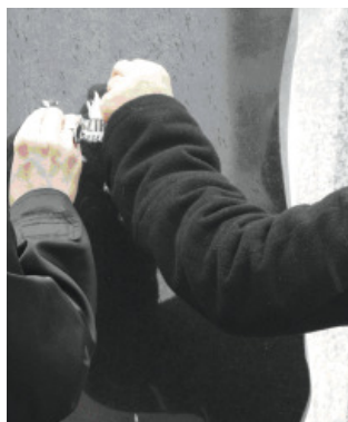
2010. Nyíregyháza – Az egykori gettó területén állított emlékműről mossák le tanárok a gyalázkodó matricákat