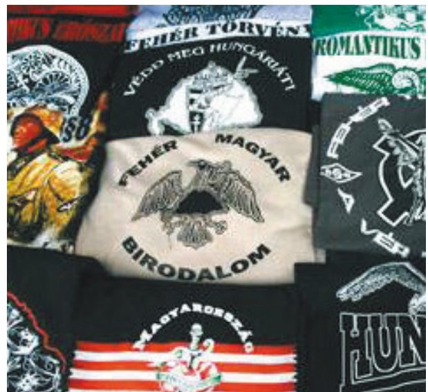
Pólóárus pultja Budapesten