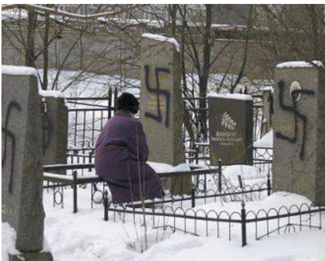
Zsidó temető meggyalázása Szentpéterváron

Izrael és a német nemzetiszocialista kormányzat összehasonlításának az a valódi célja, hogy csökkentse a holokauszt jelentőségét, és megkérdőjelezze a zsidó állam létrehozásának létjogosultságát. Ha valaki összemossa a zsidókat és a náciakat, nem csupán egy véleményt hangoztat, hanem a zsidók és Izrael ellen uszít.