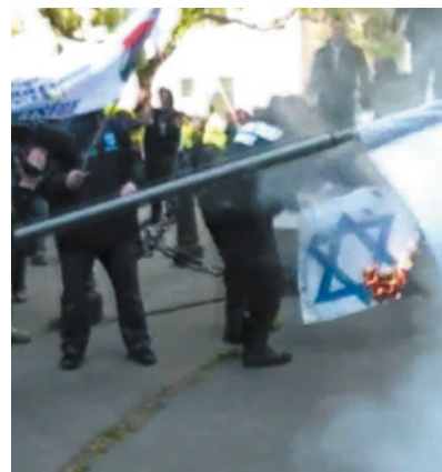
Izraeli zászló égetése Magyarországon 2011-ben