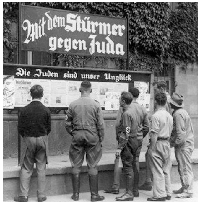
A Der Stürmer antiszemita lap hirdetőablaka. A feliratok: „A Der Stürmerrel a zsidók ellen!” „A zsidók a mi szerencsétlenségünk!”

A nürnbergi per huszonekét vádlottja között volt Julius Streicher, a Der Stürmer című antiszemita lap kiadója. A német lap a náciizmus idején több százezer példányban jelent meg, 1941 és 1944 között huszonnégy olyan cikket publikált – a többségüket maga Streicher írta –, amelyben a zsidók elpusztítását követelte. A bíróság Streichert bűnösnek találta abban, „hogy beszédeiben és írásaiban, hétről hétre, hónapról hónapra az antiszemitaizmus vírusát ültette el a németek lelkében (...) és már 1938-ban a zsidók megölésére szólított fel.” Streicher tovább folytatta a zsidók meggyilkolására uszító propagandát akkor is, amikor már folytak a tömeggyilkosságok, ezért a nürnbergi bíróság emberiség ellenes bűntettben is bűnösnek ítélte.