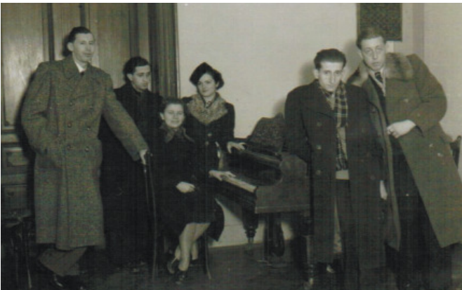
Baráti társaság Kiskunhalason az 1940-es évek elején

3. „a világ újraépül” – Értelmezzétek a vers-részletet a lenti képekkel összevetve!