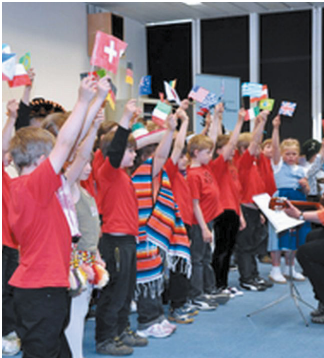
Alsó tagozatosok kórusa az ENSZ bécsi székhelyű Információs Szolgálatának „Az ENSZ és az emberi jogok” elnevezésű rendezvényén

A nürnbergi per óta két ügyben ült össze a hágai Nemzetközi Bíróság, 1993-ban a jugoszláviai háború során elkövetett emberiség elleni bűntettek, valamint 1994-ben a ruandai népirtás kivizsgálására.