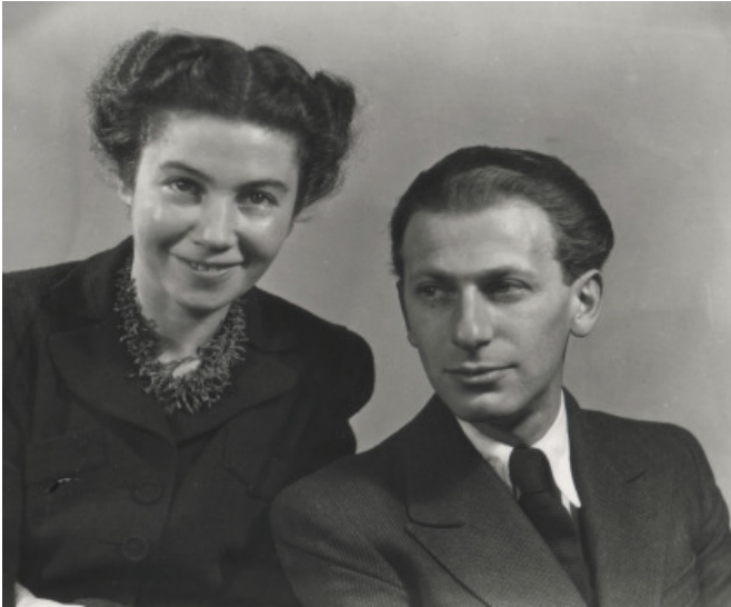
Radnóti Miklós és Gyarmati Fanni