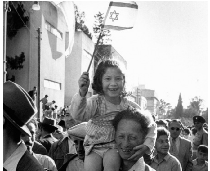
1948. május 14. Izrael függetlenségének kikiáltása

1947 elején Nagy-Britannia bejelentette, hogy kivonul a területről, és ugyanazon év novemberében az Egyesült Nemzetek Szervezete határozatot fogadott el az egykori brit mandátum felosztásáról. Számos arab ország azonban a határozat ellen szavazott.