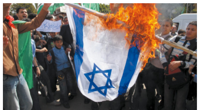
... és Gázában