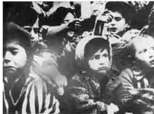
Djeca u logoru, podižu ruke u trenutku oslobođenja, Auschwitz, Poljska.