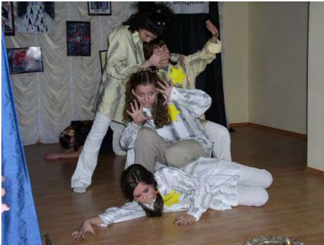
Predstava Zaporoške JCC plesne skupine kao dijela projekta Maraton sjećanja, Ukrajina 2005, Tkuma (Središnja ukrajinska fondacija za holokaust)

27. siječnja 2005., Središnja ukrajinska fondacija za holokaust "Tkuma" organizirala je projekt poznat pod imenom "Maraton sjećanja", s ciljem da poveća svijest o holokaustu u desecima ukrajinskih gradova i mjesta. Događaji su uključivali nagradne ceremonije za studente koji su sudjelovali u natjecanjima o holokaustu; "Marševe živućih" na autentična mjesta stradavanja žrtava holokausta; okrugle stolove studenata s poznatim osobama; i konferenciju za tisak sa predstavnicima međunarodnih i lokalnih medija vezano uz 60 godišnjicu komemoracije oslobođenja Auschwitz – Birkenau. U Odesi, komemoraciju je obilježila kombinacija literarnih i umjetničkih slika i priča Elie Wiesel, preživjele žrtve holokausta i dobitnice Nobelove nagrade. Državni i lokalni dužnosnici također su sudjelovali u tim događajima.