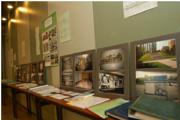
Izložba učeničkih projekata na konferenciji "Živa povijest litvanskih Židova" na Dan sjećanja na holokaust u Litvi, 23. rujna 2004.

Na Dan sjećanja na holokaust u Poljskoj, 19. travnja, školska djeca iz Lublina u Poljskoj kao i djeca iz okolnih gradova napisali su 500 pisama Heniu Žytomirskom, desetgodišnjem dječaku, poljskom Židovu, koji je ubijen u Majdaneku 1942. Taj je projekt inicirala Grodzka Gate – Kazalište NN. Učenici su poslali poštom svoja pisma ubacivši ih u specijalno dizajnirani sandučić. Sva su se pisma vratila pošiljaocima sa žigom "adresa ne postoji, primatelj nepoznat" kako bi se stvorio poticaj za diskusiju kod kuće o tome što se dogodilo sa židovskom populacijom u Europi za vrijeme holokausta.