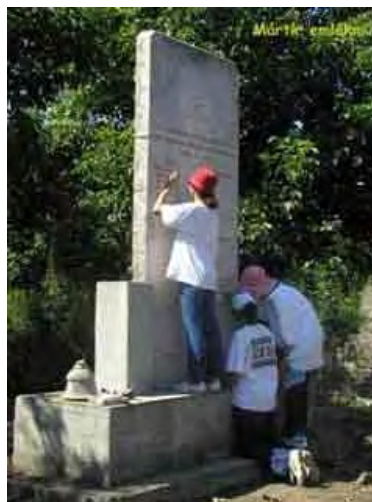
Učenici čiste napušteno židovsko groblje u Szobu, Mađarska, 2002. (Škola Židovske zajednice Lauder Javne u Budimpešti)