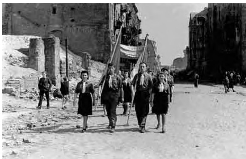
Varšava, Poljska, poslije rata: Memorijalni marš za žrtve holokausta.

Dan sjećanja na holokaust je relativno nova pojava u nekim zemljama, dok je to u drugim zemljama već dugogodišnja tradicija. Vlade su inicirale i organizirale službene ceremonije i posebne parlamentarne sjednice obilježavajući Dan sjećanja na holokaust, što je bilo objavljeno u lokalnim, nacionalnim i međunarodnim medijima.