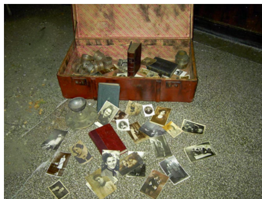
Ovaj kovčeg, dio projekta za Dan sjećanja na postavili su učenici Kluba sjećanja, Vlaicu Voda National College, Rumunjska, Listopad, 2004.