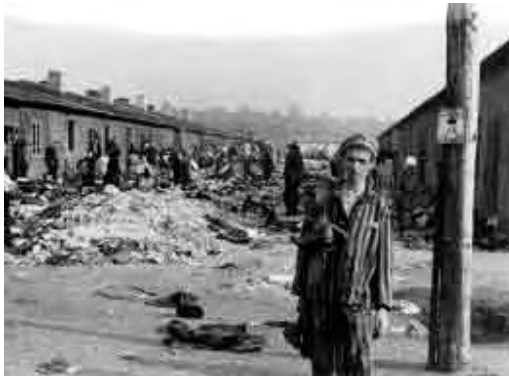
Bivši zatočenik blizu baraka logora Bergen.Belsen, Njemačka

Nastavnici mogu organizirati susrete učenika sa svjedocima (naročito preživjelim žrtvama holokausta, ali i sa osloboditeljima i spasiteljima) koji se sjećaju svojih iskustava iz vremena Drugog svjetskog rata. Stvarni iskazi su vrlo snažni i mogu doprinijeti dubokom iskustvu učenika. Nadalje, prije snimljeni vizualni povijesni iskazi također mogu biti uticajno oruđe za poduku. Nastavnici se mogu koncentrirati na ono što su učenici doznali iz slušanja osobnih priča svjedoka i na impresije koje su ponijeli sa sobom slušajući svjedočenja preživjelih.