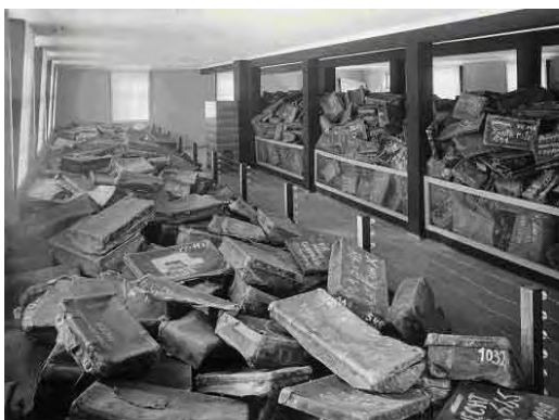
Auschwitz, Poljska, nakon rata: Kovčez u muzeju Yad Vashem Ovaj kovčeg, dio projekta za Dan sjećanja na

U Norveškoj, Direktorat za osnovne i srednje škole potiče sve škole na komemoraciju Dana sjećanja na holokaust i daje obrazovne izvore na svojim web stranicama. Mnoge škole organiziraju recitale poezije i izložbe, dok druge organiziraju procesije sa bakljama i pozivaju preživjele i svjedoke da ispričaju svoje osobne priče.