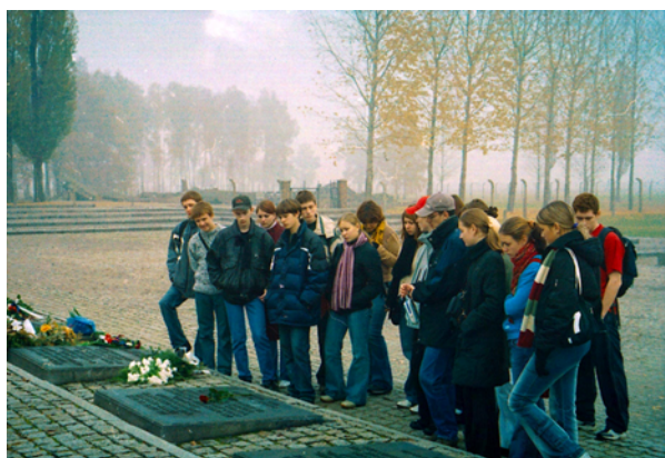
Postavljanjem cvijeća na spomeniku u Birkenau, 27. listopada 2004. Ruski učenici srednje škole iz Moskve sudjelovali su na seminaru "Auschwitz – povijest i simbolika" kojeg je organizirao državni muzej Auschwitz – Birkenau.