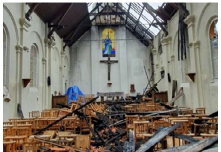
Наслідки підпалу церкви у Франції, 4 липня 2020.