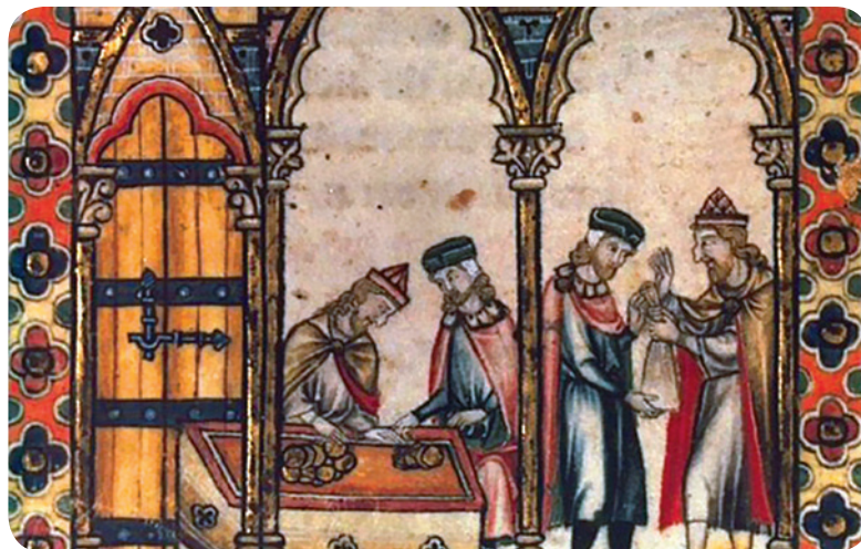
Јевреји, позајмљивачи новца у Француској, око 1270. године

Многи хришћански владари су забрањивали Јеврејима да поседују земљу. Како нису могли да се баве земљорадњом, Јевреји су живели углавном у градовима. Али, и у градовима им је било забрањено да се баве читавим низом професија или да тргују са одређеним врстама робе. Разлог овакве политике лежао је пре свега у чувању монопола и спречавању конкуренције домаћим трговцима и занатлијама, при чему је дискриминаторска политика оправдавана различитим антисемитистичким предрасудама. С друге стране, хришћански владари су позивали Јевреје да раде за њих као скупљачи пореза или да се баве позајмљивањем новца (јер је црква забрањивала хришћанима да се тиме баве). Без много могућности избора, Јевреји су били принуђени да се баве оним занимањима која им у датом тренутку и на том месту нису била забрањена. Тако су, нпр. у Италији и Енглеској, припадници јеврејске заједнице често били кројачи. Неки су Јевреји били лекари, правници, тумачи, учењаци или су се бавили другим професијама за које је било потребно посебно стручно знање и вештина. Присиљени да буду стално на опрезу од нових протеривања и погрома, један од мотива за избор оваквих професија био је тај да, и ако им опљачкају имовину и отерају их, увек могу да своје стручно знање примене и у некој другој земљи.