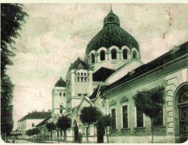
Синагога у Панчеву

Синагога у Панчеву изграђена је 1909. године. Била је једна од најлепших зграда и један од симбола града Панчева, као и једна од најлепших синагога у Војводини. Преживели малобројни Јевреји нису били у могућности да одржавају храм, па су га 1955. године поклонили граду на бригу и чување. У наредном периоду синагога је продата, највећим делом срушена, а остаци су оштећени у пожару 2007. године.