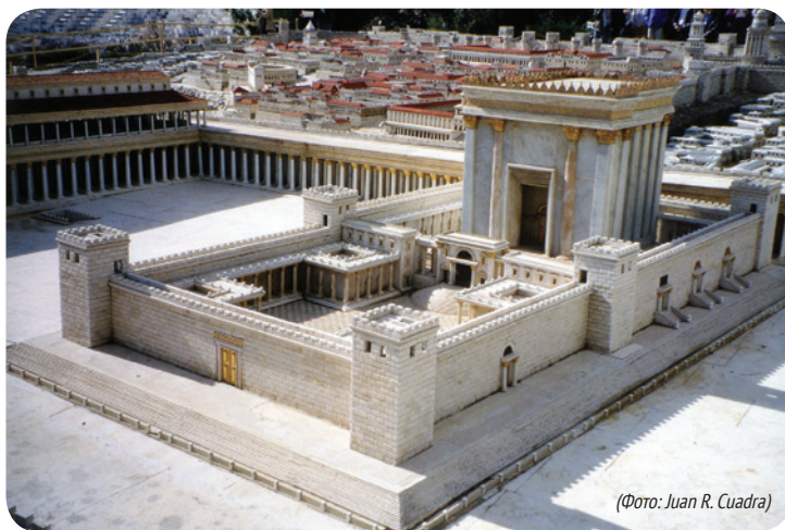
Модел јерусалимског храма у Музеју Израела

Првобитна историја Јевреја одвијала се на простору данашњег Израела, где су Јевреји, крајем другог миленијума пре нове ере, створили своју државу. Овај простор се назива и Палестина, по Филистејцима, народу са којим су Јевреји у то време водили борбу за превласт. Јевреји су били први народ који је прихватио монотеизам , односно веровање у једног бога. Најстарија јеврејска историја описана је у књизи коју Јевреји називају Танах , а хришћани Стари завет . У њој су садржана народна предања, правне и моралне норме, које су извршиле велики утицај на друге монотеистичке религије, хришћанство и ислам. У време цара Давида јеврејска држава је достигла врхунац моћи и пространства. Под његовим наследником, царем Соломоном, током X века пре нове ере, у Јерусалиму је подигнут велелепни храм . После Соломонове