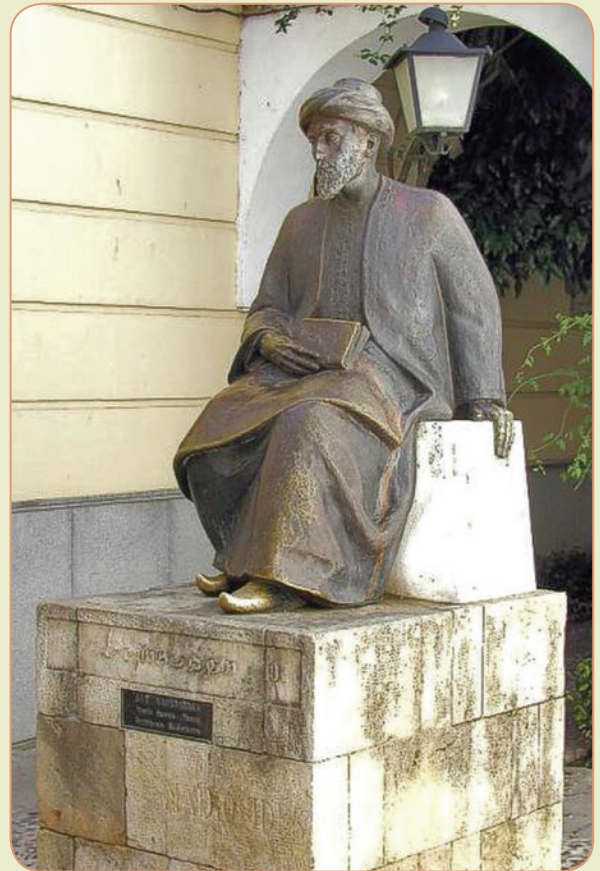
Рабин и филозоф Мојсије Мајмонид , споменик у Кордоби

У шпанској јеврејској заједници деловао је низ истакнутих стваралаца међу којима је најчувенији био рабин и филозоф Мојсије Мајмонид. Рођен је у Кордоби средином XII века, већи део живота је путовао, а коначно се настанио у Каиру и био лекар султана Саладина. Писао је на арапском и хебрејском, а његова дела из филозофије, јеврејске религије и традиције, као и из медицине су утицала на мисао широког круга учених људи.