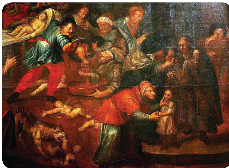
„Крвна клевета”, слика Карола де Превота, катедрала у Сандомјежу, Пољска (XVIII век)

Један од злонамерних митова о Јеврејима, настао још у XII веку, био је да Јевреји „отимају и убијају хришћанску децу да би ритуално користили њихову крв за верске ритуале”. Оптужбе да Јевреји врше „ритуална убиства” су део типичних антисемитистичких наратива који се, у различитим формама, појављују и данас.