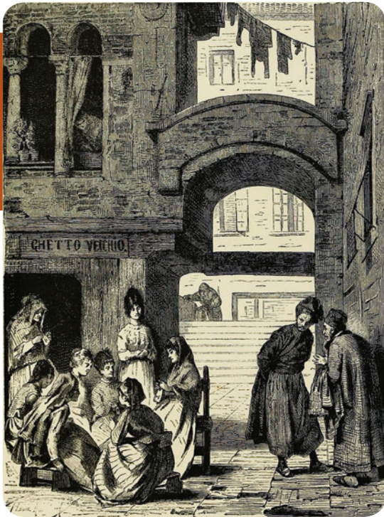
Гето у Венецији

На минијатури из средњовековне француске хронике приказан је прогон Јевреја из Француске 1182. године.