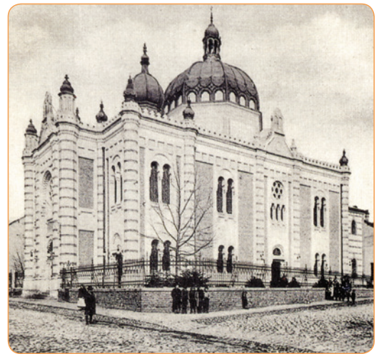
Синагогу у Зрењанину су срушили Немци 1941. године.

Јеврејске заједнице на простору Војводине су од друге половине XIX века настојале да свој просперитет истражу и подизањем што лепших синагога. Осим синагога у Новом Саду и Великом Бечкерек (данас Зрењанин), једна од најимпозантнијих је синагога у Суботици подигнута почетком XX века у стилу мађарске сецесије. У Војводини је постојало 78 синагога, од којих су данас остале само три. Многе су уништене за време Другог светског рата, а многе су пропале и срушене током деценија после рата због неодржавања и немара, јер су многе јеврејске заједнице потпуно уништене у Холокаусту, па више није било Јевреја да брину о својим локалним синагогама.