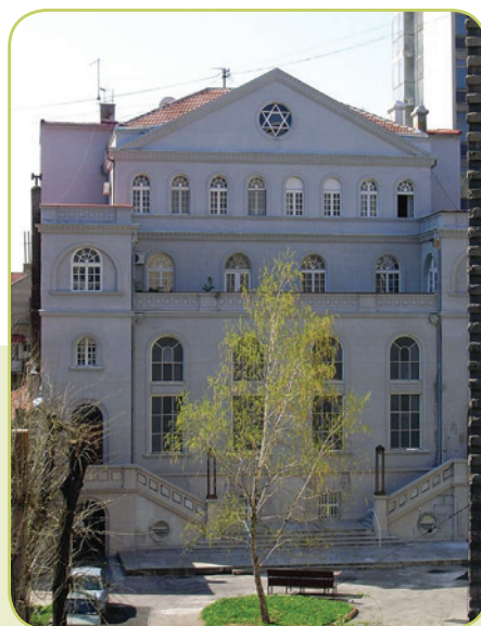
Београдска синагога Сукат Шалом

После Другог српског устанка 1815. године почео је нови успон јеврејске заједнице у Србији. Осим у Београду, веће јеврејске заједнице развијале су се у Нишу, Шапцу, Смедереву, а после балканских ратова 1912/1913. и у Приштини, Битољу, Скопљу и Штипу.