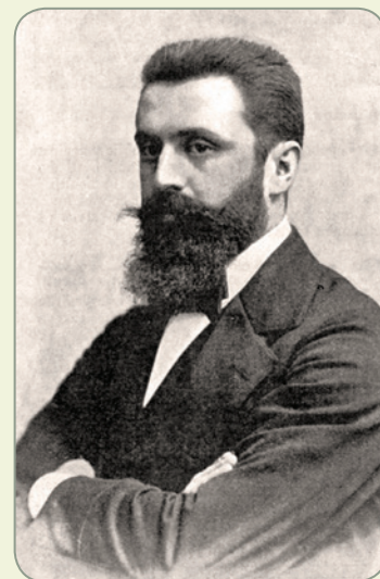
Теодор Херцл (1860–1904)