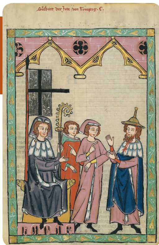
Сускинд, Јеврејин из Тримберга, илустрација из Кодекс Манес

предрасуде – негативни судови или мишљења о некој особи, друштвеној групи или појави који се не заснивају на истинитом искуству нити на разумним доказима.