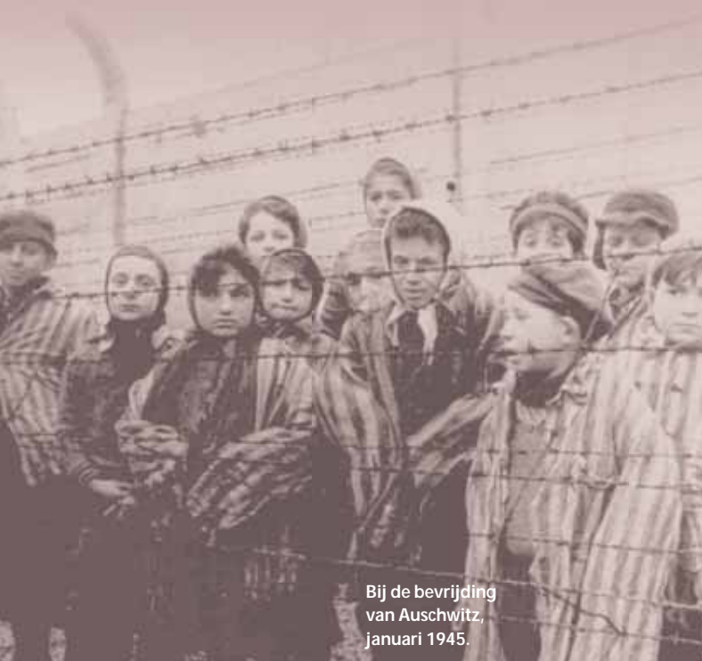
Bij de bevrijding van Auschwitz, januari 1945.

Ik zie het als mijn plicht om anderen te vertellen wat ik heb meegemaakt en te strijden tegen discriminatie. Ook op die manier heeft Auschwitz mijn leven bepaald. Je hoeft niet altijd iets groots te doen. Door gewoon je burens te helpen, verander je al iets in hun leven. Het gaat erom dat je open staat voor een ander.'