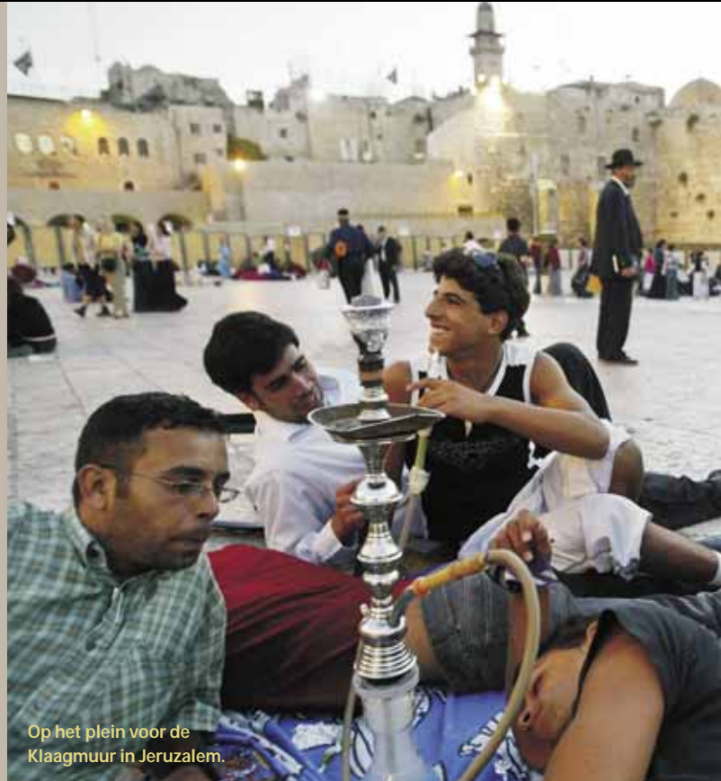
Op het plein voor de Klaagmuur in Jeruzalem.