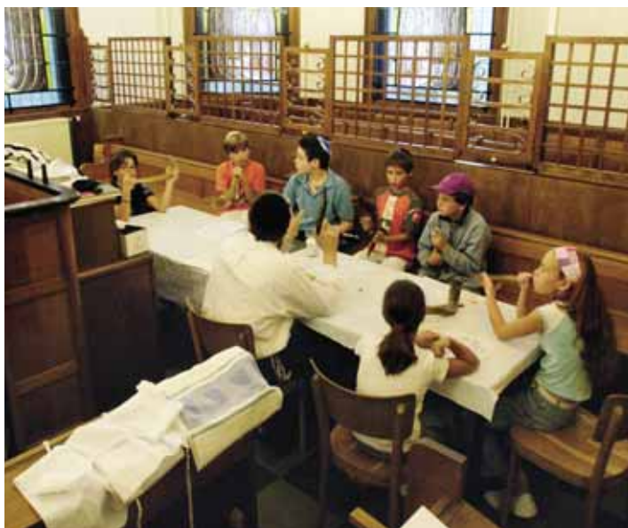
Sjoel Haarlem, 2005.

C. Wissel je antwoorden op A en B uit in je groep.