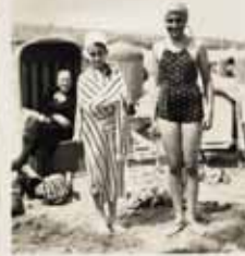
Dagboek van Anne Frank.