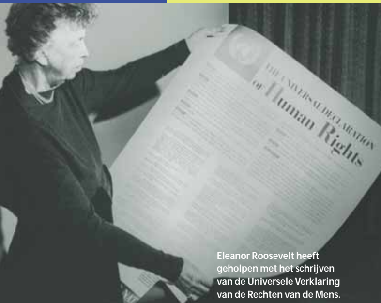
Eleanor Roosevelt heeft geholpen met het schrijven van de Universele Verklaring van de Rechten van de Mens.

Het proces tegen Eichmann was bijzonder omdat beelden van de rechtszaak – televisie bestond nog maar net – in de huiskamers te zien waren. Slachtoffers kwamen aan het woord. Iedereen zag de woede en het verdriet van de mensen in de zaal. En iedereen hoorde Eichmann zeggen dat hij gedaan had wat hem was opgedragen. Dat was een schokkende verklaring. Steeds duidelijker werd toen hoeveel mensen de nazi's hadden geholpen, gewoon omdat ze 'hun plicht' hadden gedaan.