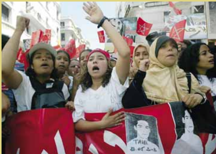
Demonstratie in Casablanca, 2003.

Sommige mensen vergelijken Israël met nazi-Duitsland: 'Wat de nazi's met de joden deden, doet Israël nu met de Palestijnen.' Die vergelijking klopt niet. Nazi's wilden bewust alle joden vermoorden. Door de acties van de Israëlische regering zijn Palestijnen gedood, maar Israël is nooit van plan geweest alle Palestijnen om te brengen. Het conflict gaat in de eerste plaats om grondgebied.