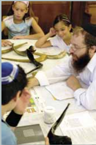
Joodse les in Haarlem.

Joden probeerden na de oorlog een nieuw bestaan op te bouwen. In Europa kwam langzaam iets van de joodse cultuur terug. Er werden bijvoorbeeld weer synagogen geopend. Tegelijkertijd kregen Europeanen te maken met nieuwe uitingen van antisemitisme. De ontkenning van de holocaust is daar een voorbeeld van.