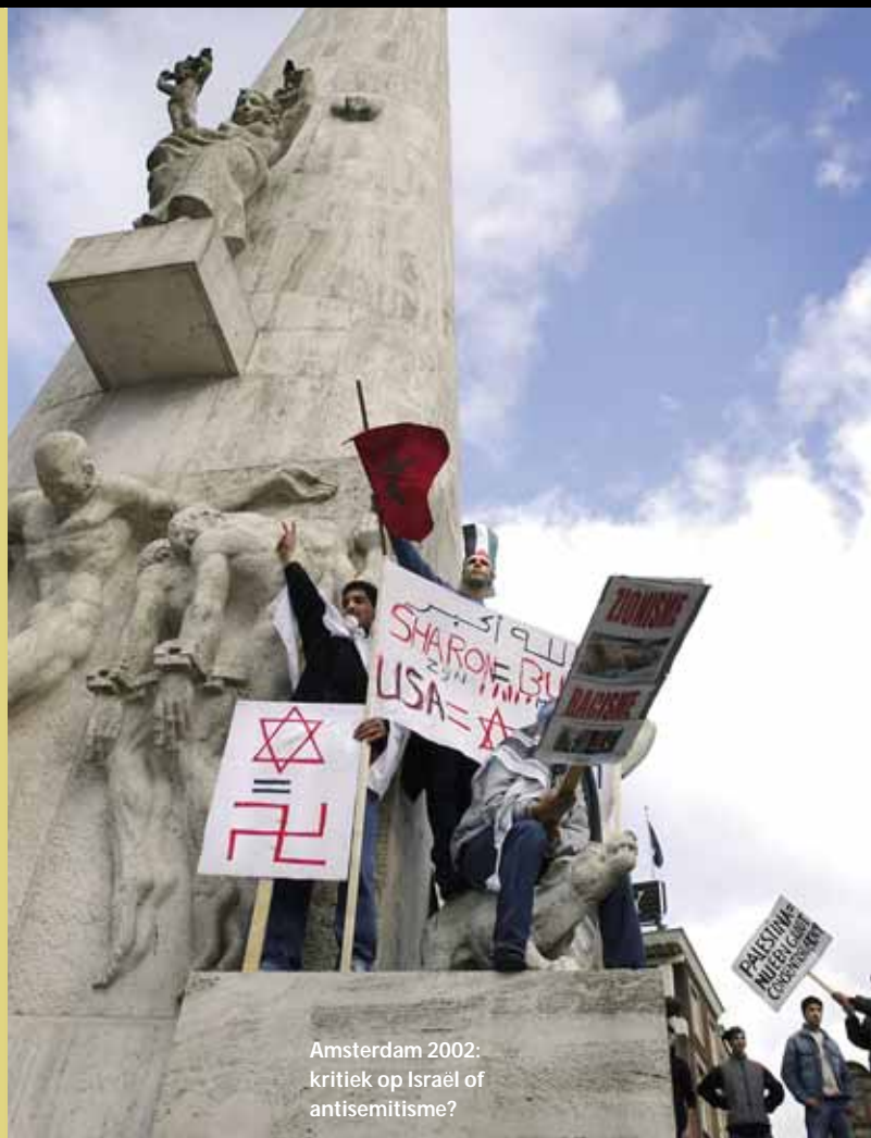
Amsterdam 2002: kritiek op Israël of antisemitisme?