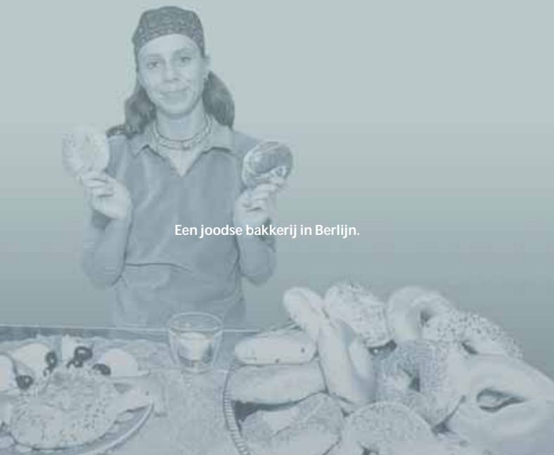
Een joodse bakkerij in Berlijn.

Mensen die beweren dat de holocaust een leugen is, doen dit om joden te kwetsen. Daarom is de ontkenning van de holocaust in veel Europese landen strafbaar.