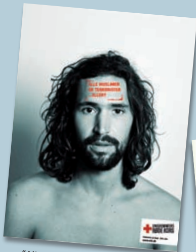
"Alle muslimer er terrorister...eller?" (Ungdommens Røde Kors, Danmark)