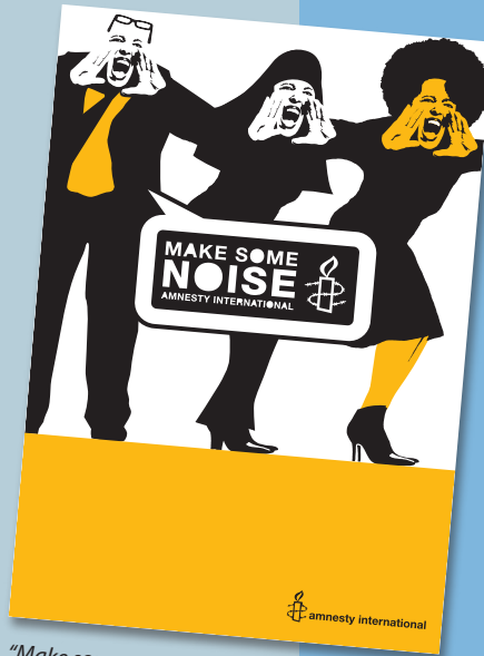
"Make some noise." (Amnesty International Danmark)