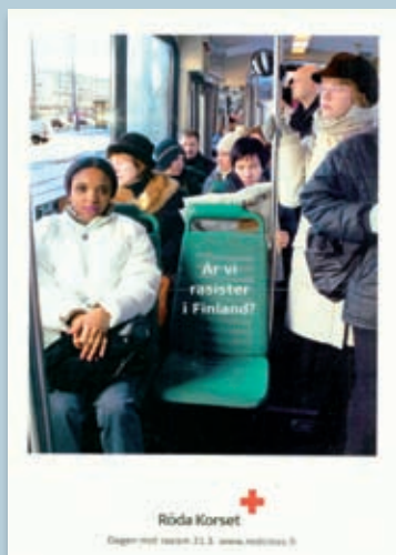
"Er vi racister i Finland?" (Finsk Røde Kors)