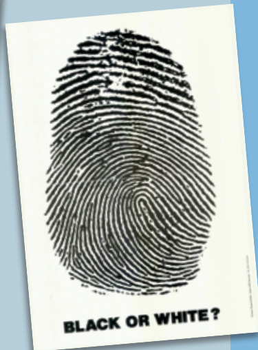
"Sort eller hvid?" (Anti-Racism Information Center, Holland)