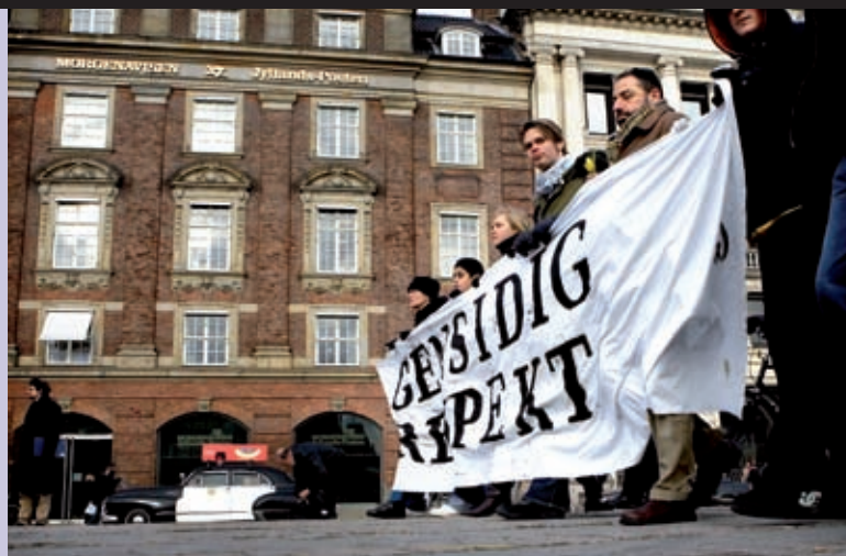
Demonstration for gensidig respekt foran Jyllands-Postens bygning i København. Både muslimer og ikke-muslimer demonstrerer.