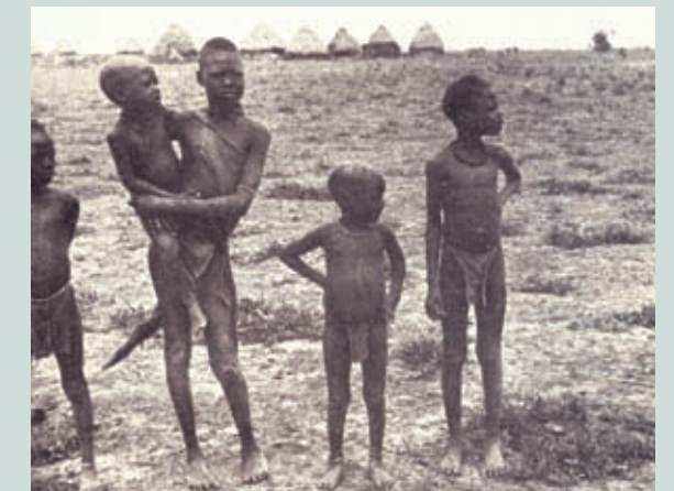
Billede fra geografibog (1937).

B. Læs afsnittet "Racisme – også i dag". Hvorfor inddeler man ikke længere verdens befolkning i racer?