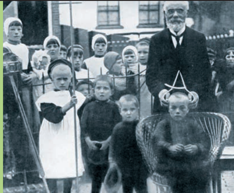
En videnskabsmand måler børns hoveder på øen Urk i Holland (1910).