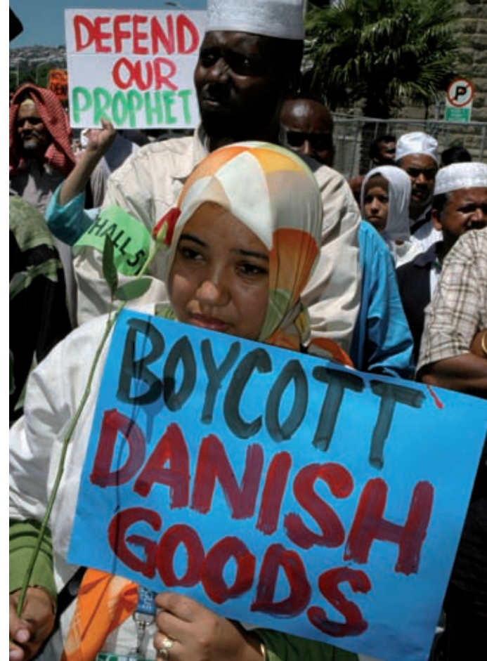
Muslimer demonstrerer imod de danske tegninger af profeten Muhammed.