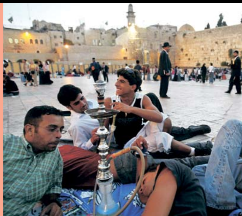
Unge israelere foran Vestmuren (også kaldet "Grædemuren") i Jerusalem.

Den antisemitisme, jøder oplevede flere steder i Europa i 1800-tallet, forstærkede ønsket om deres eget land, hvor de kunne leve i fred. De første europæiske zionister bosatte sig i Palæstina allerede i begyndelsen af 1900-tallet. De købte land fra arabiske jordejere og grundlagde jødiske samfund, der med tiden voksede sig større og større. I begyndelsen levede jøder og arabere fredeligt side om side, men med tiden førte spørgsmålet om land til splittelse. De