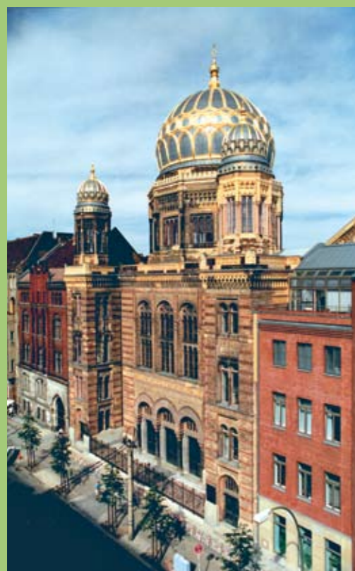
I Berlin blev denne synagoge genopbygget efter 2. Verdenskrig.

Efter Holocaust forsøgte de jødiske overlevende i Europa at begynde en ny tilværelse. Med tiden genopstod dele af den jødiske kultur, og der blev opført nye synagoger flere steder. Men jødehadet forsvandt ikke, og selv den dag i dag findes der personer og grupper med samme holdninger som Hitler. Nynazister rundt om i verden forsøger at videreføre Hitlers ideologi og betragter den 'hvide race' som overlegen. Nynazister ser ned på jøder og andre minoriteter, og nogle ønsker endda at 'rense' samfundet ved at skille sig af med minoriteterne. Nynazisterne spreder især deres ideer via internettet.