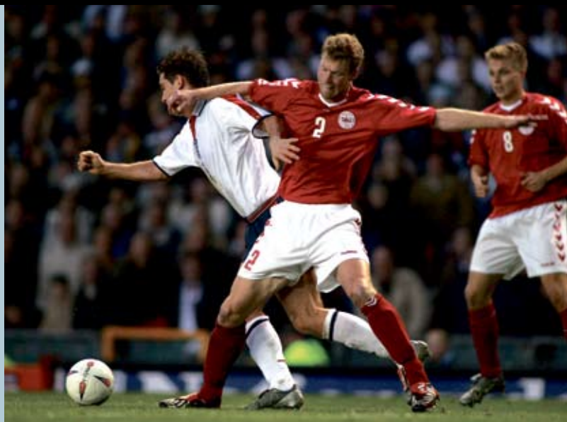
Morten Wieghorst i en landskamp mod England.