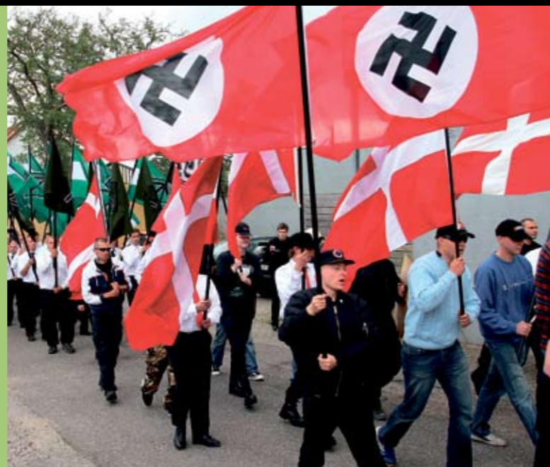
En gruppe nynazister fejrer 20-årsdagen for Rudolf Hess' død ved en mindemarch i Kolding, august 2007. Rudolf Hess var Hitlers fortrolige og indtil 1939 næstkommanderende i nazistpartiet.