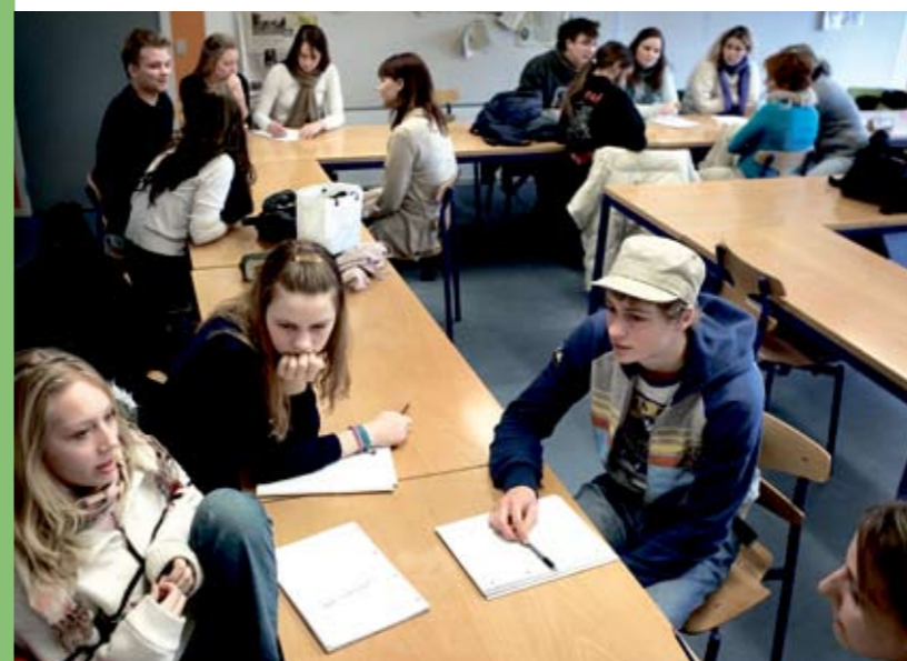
I januar 2006 diskuterede danske gymnasieelever Holocaustbenægtelse i forbindelse med Auschwitz-dagen – den danske mærkedag for Holocaust og andre folkedrab. En elev sagde bagefter: "Diskussionen om benægtelse fik mig til at tænke på, hvor forsigtig man skal være med at tro på alt, man hører eller læser."

Der er eksempler på, at nynazister sammenligner Holocaust med andre begivenheder, fx de allieredes bombninger af tyske byer som Dresden under 2. Verdenskrig. Den slags påstande har til formål at få nazisternes forbrydelser til at virke mindre grufulde og signalere, at andre i krigen 'gjorde det samme'. Men det er en fordrejning af historien. Selvom mange civile (almindelige mennesker, der ikke deltog i krigen som soldater) mistede livet under angrebet på Dresden, kan det ikke sammenlignes med nazisternes plan om at udlette alle jøder i hele Europa.