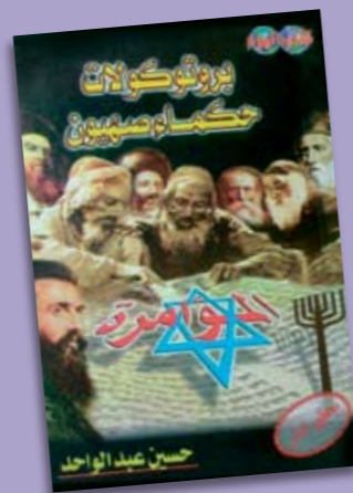
Den arabiske udgave af "Zions vises protokoller", 1976 – og den russiske fra 1922.

Ideologi er et politisk tankesæt, dvs. en 'pakke' af holdninger og idéer, der handler om, hvordan et samfund skal se ud. Eksempler på ideologier er socialisme, konservatisme, liberalisme og kommunisme. Nazisterne havde en særlig raceideologi, der inddelte mennesker i racer, som var mere eller mindre værd. Den 'ariske race' – dvs. idéen om et slags germansk herrefolk – blev anset for at være alle andre racer overlegen, og dette folk skulle derfor herske i et stort tysk rige. Den 'jødiske race' blev set som den laveste og som en trussel mod Tyskland.