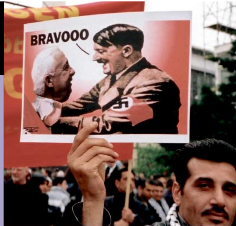
Demonstration for palæstinenserne i Berlin, 2002. Nogle af demonstranterne sammenligner Israels og Nazitysklands politik

Hundredvis af marokkanere gik på gaden i protest mod et angreb på en jødisk bygning i hovedstaden Casablanca i 2003.