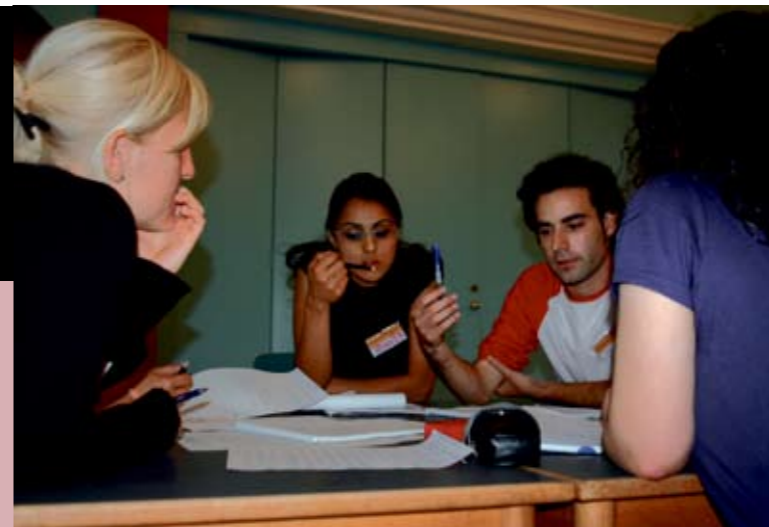
Unge jordanere, palæstinensere, jødiske og arabiske israelere mødes gennem projektet Crossing Borders.