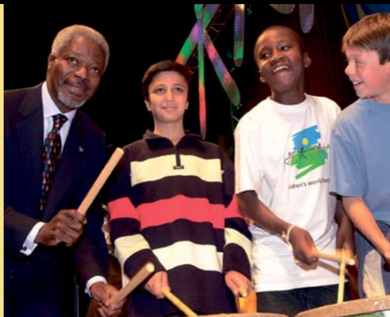
Kofi Annan, generalsekretær for FN 1997-2006, har engang sagt: "Jeg bliver opmuntret af, at flere og flere mennesker indser, at verden bliver mindre; at dit problem er mit problem, og mit problem er dit problem." På billedet ses Kofi Annan sammen med en gruppe børn ved Verdens Børn Festivalen i Schweiz, 2000.

I den tyske by Nürnberg blev 22 ledende nazister i 1945-46 retsforfulgt ved den første internationale straffedomstol. Nürnberg-domstolen skulle bl.a. dømme personer, der var ansvarlige for jødeudryddelserne under krigen. I den forbindelse opstod idéen om en permanent international domstol. Denne domstol skulle tage sig af overtrædelser af internationale regler for fx krigsførelse og af forbrydelser som folkedrab. Uenighed og magtkampe mellem USA og Sovjetunionen bremsede imidlertid