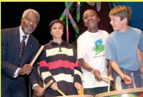
Jungtinių Tautų Generalinis sekretorius Kofi Annanas (iki 2006 m.) Pasauliniame vaikų festivalyje, 2000 m., Bazelis, Šveicarija. „Kova su antisemitizmu – tai kova už žmonijos ateitį.“

1961 m. Adolfo Eichmanno teismas dar kartą atskleidė neįtikėtinai didelį nacių nusikaltimų mastą. Eichmannas buvo atsakingas už žydų pervežimą į mirties ir koncentracijos stovyklas. Teismas buvo ypatingas ir tuo, kad buvo rodomas per televiziją ir kiekvienas, turėjęs namie televizorių – tuo metu sparčiai plintančią naujovę, – galėjo jį stebėti. Žmonės pritrėnkė Eichmanno gynybos argumentas: „Aš tik vykdžiau įsakymus.“ Tai buvo akibrokštas, žinant, kad daugybė persekiojimų ir žudynių įvykdė tie, kurie „tik vykdė savo pareigą“.