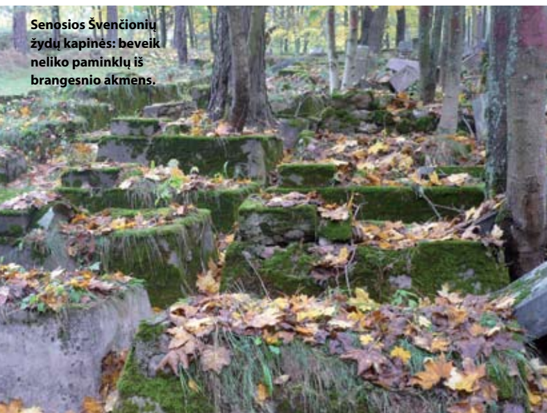
Senosios Švenčionių žydų kapinės: beveik neliko paminklų iš brangesnio akmens.