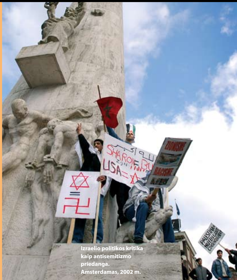
Izraelio politikos kritika kaip antisemitizmo priedanga. Amsterdamas, 2002 m.

Kai kurie žmonės Izraelio politiką lygina su nacių Vokietija: „Izraeliečiai elgiasi su palestiniečiais taip, kaip naciai su žydais.“ Tai iš esmės neteisingas palyginimas. Valstybinė nacių politika siekė sunaikinti visus žydus. Izraelis – demokratinė valstybė, ir nevykdo rasistinės politikos. Izraelio-palestiniečių konfliktas, dėl kurio abi pusės turi aukų, yra teritorinis. Dabartinės Izraelio politikos sulginimas su nacių Vokietijos politika iš tiesų menkina holokausto tragediją bei kelia abejonių Izraelio valstybės egzistavimo teisėtumu. Tokie sulginimai sunkina Izraelio-palestiniečių taikos derybas.