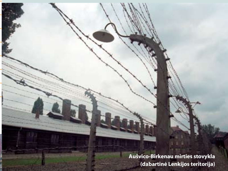
Aušvico-Birkenau mirties stovykla (dabartinė Lenkijos teritorija)

B. Ką žinai apie Aušvico-Birkenau mirties stovyklą?