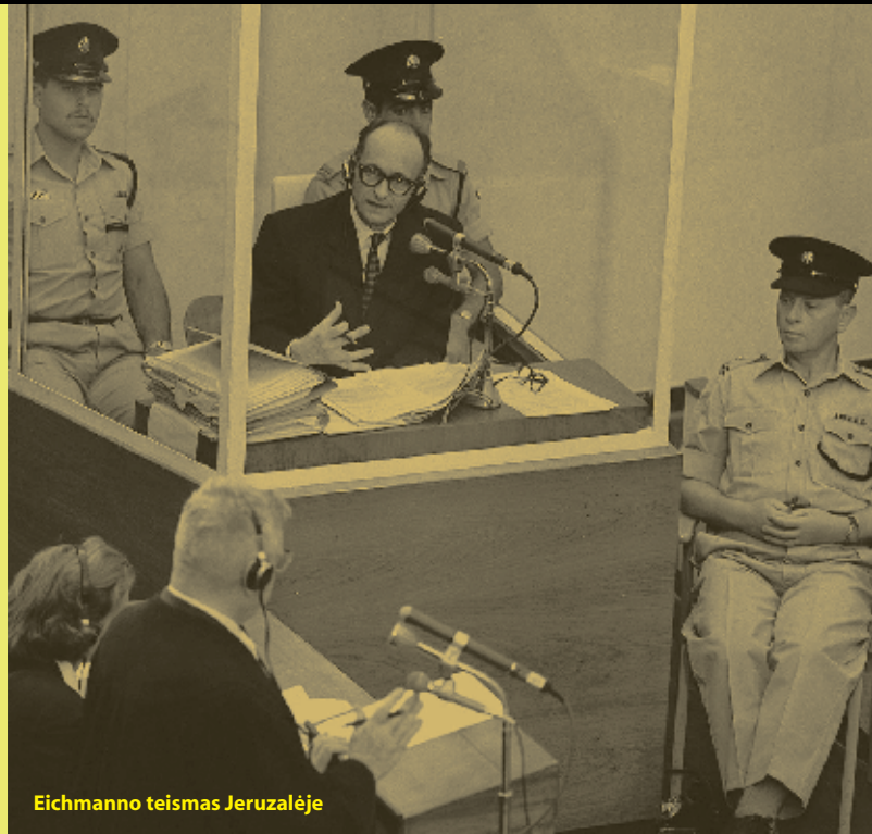
Eichmanno teismas Jeruzalėje