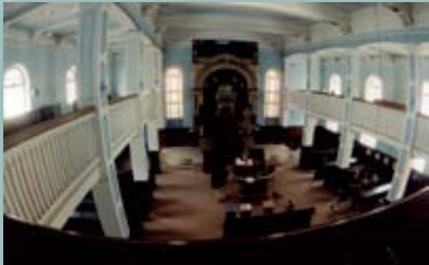
Kauno choralinė sinagoga (pastatyta 1872 m.)

Holokaustą pergyvenę žydai, likę gyventi savo gimtosiose šalyse, kūrė naują gyvenimą, stengėsi atgaivinti kultūrą ir tradicijas. Tačiau jie susidūrė su naujomis antisemitizmo formomis. Viena iš jų – holokausto neigimas.