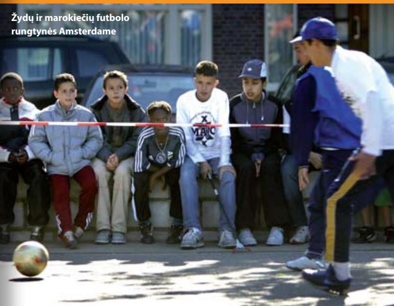
Žydų ir marokiečių futbolo rungtynės Amsterdame