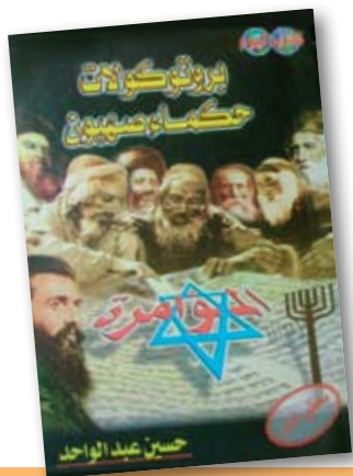
„Siono išminčių protokolų“ vertimas į arabų kalbą, 1976 m.