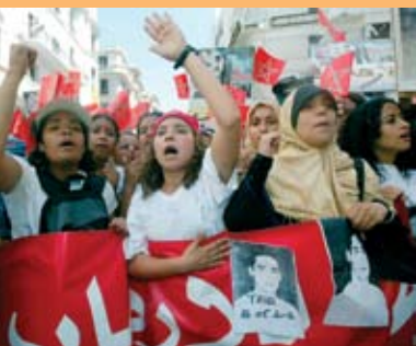
Diasporos žydai yra pastoviai puldinėjami. 2003 m. Kasablankoje (Maroke) buvo užpuolta keletas namų, taikytasi į žydus, nužudyti 54 žmonės. Protestuodami prieš šiuos išpuolius, marokiečiai išėjo į gatves.