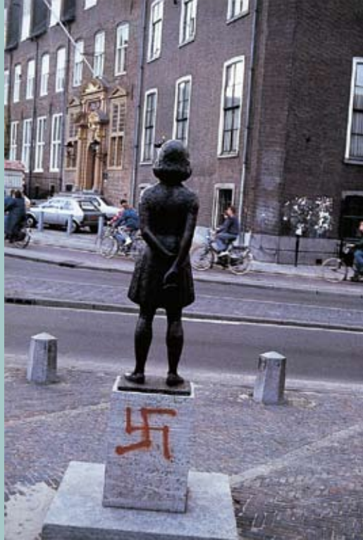
Anos Frank paminklas Utrechte, Olandijoje