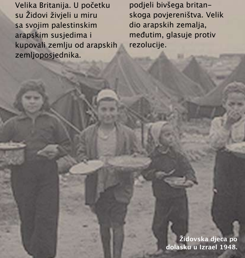
Židovska djeca po dolasku u Izrael 1948.

Cionizam je ime židovskoga pokreta koji se zalaže za neovisnost židovske države u Palestini.