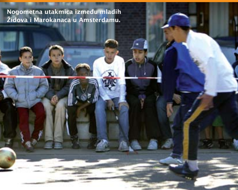
Nogometna utakmica između mladih Židova i Marokanaca u Amsterdamu.