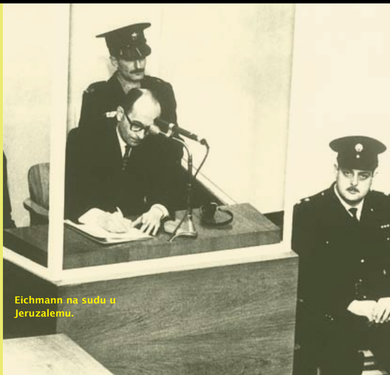
Eichmann na sudu u Jeruzalemu.