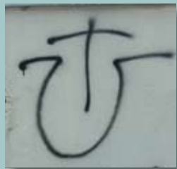
Antisemitski grafit i ustaški simbol, Split, 2006.

Nacističke ideje nisu posve nestale nakon oslobođenja. Čak i sada postoje skupine neonacista u Europi i Sjedinjenim Američkim Državama. Kao i Hitler, oni smatraju da je 'bijela rasa' najbolja. Oni su protiv manjina, pa tako i protiv Židova. Prema neonacistima, Židovi su sami izmislili holokaust. Tvrdе da su Židovi sami izmislili Auschwitz kako bi dobili potporu za osnivanje vlastite države. Također tvrde da dnevnik Anne Frank nije autentičan i da je napisan nakon rata.