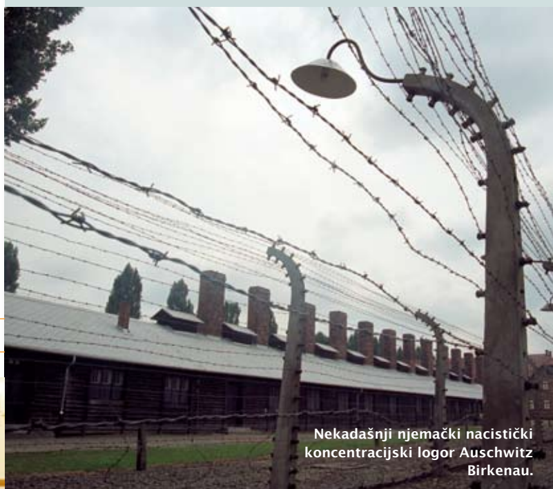
Nekadašnji njemački nacistički koncentracijski logor Auschwitz Birkenau.

B. Napiši kako se u tvojoj školi obilježava Dan sjećanja na holokaust i sprječavanje zločina protiv čovječnosti.