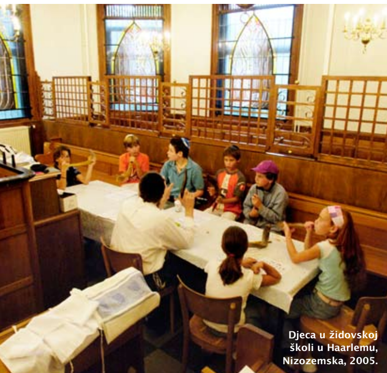
Djeca u židovskoj školi u Haarlemu, Nizozemska, 2005.

2. Ministarstvo prosvjete i športa Republike Hrvatske doni-jelo je 2003. odluku da se svake godine 27. siječnja obilježava Dana sjećanja na holokaust i sprječavanje zločina protiv čovječnosti. Godine 2005. Ujedinjeni su se narodi složili da će se 27. siječnja, dan kad su sovjetske trupe oslobodile Auschwitz, obilježavati kao Dan sjećanja u svim zemljama.