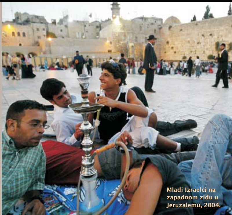
Mladi Izraelci na zapadnom zidu u Jeruzalemu, 2004.

Židovi su započeli emigraciju iz Europe u Palestinu u 19. stoljeću kako bi pobjegli od antisemitizma. Povećavali su postojeće židovske zajednice živeći na zemlji koju su kupovali od arapskih zemljoposjednika. Britanski upravitelji su davali nadu i Židovima i Palestincima da će moći osnovati svoju vlastitu državu. Želja obiju grupa da osnuju svoju vlastitu državu na istome području začetak je sukoba oko teritorija koji traje do današnjeg dana. Godine 1947. Velika Britanija najavljuje povlačenje s teritorija, a u studenome Ujedinjeni narodi usvajaju rezoluciju o podjeli bivšega britanskoga povjereništva. Velik dio arapskih zemalja, međutim, glasuje protiv rezolucije.