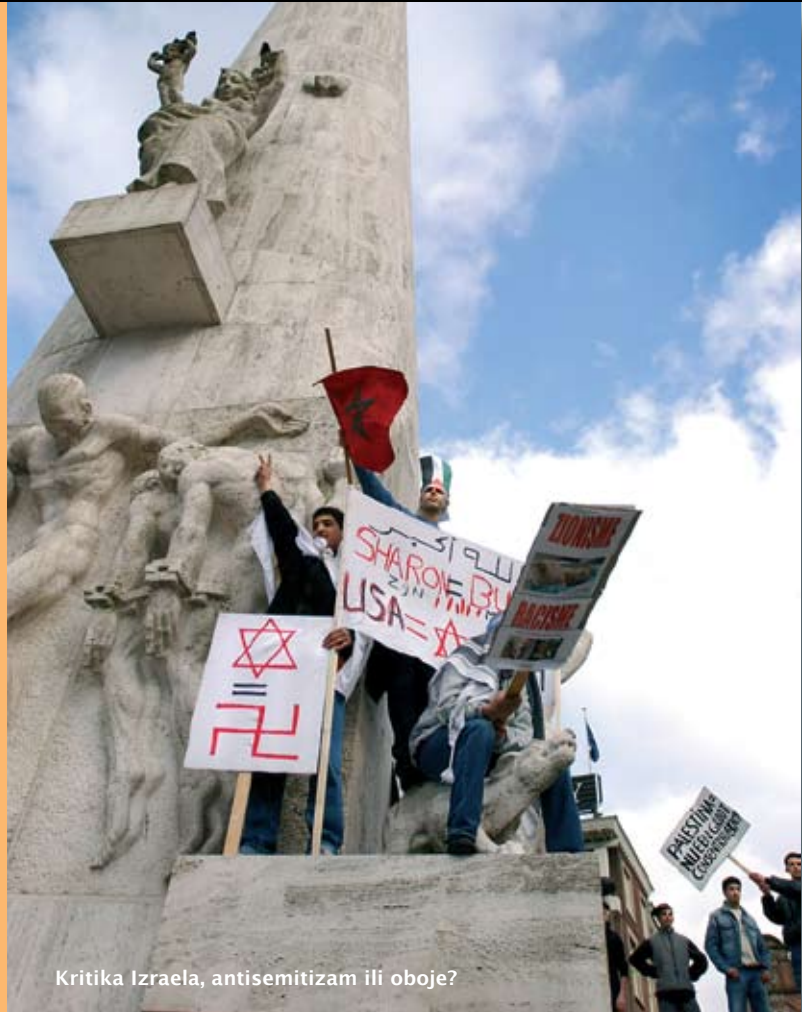
Kritika Izraela, antisemitizam ili oboje?

Židove se napada izvan Izraela. Godine 2003. napadnuto je nekoliko zgrada u Casablanci gdje su cilj bili Židovi. Ubijeno je pedeset i četvero ljudi. Odmah zatim Marokanci su izišli na ulice protestirajući protiv takvih napada.