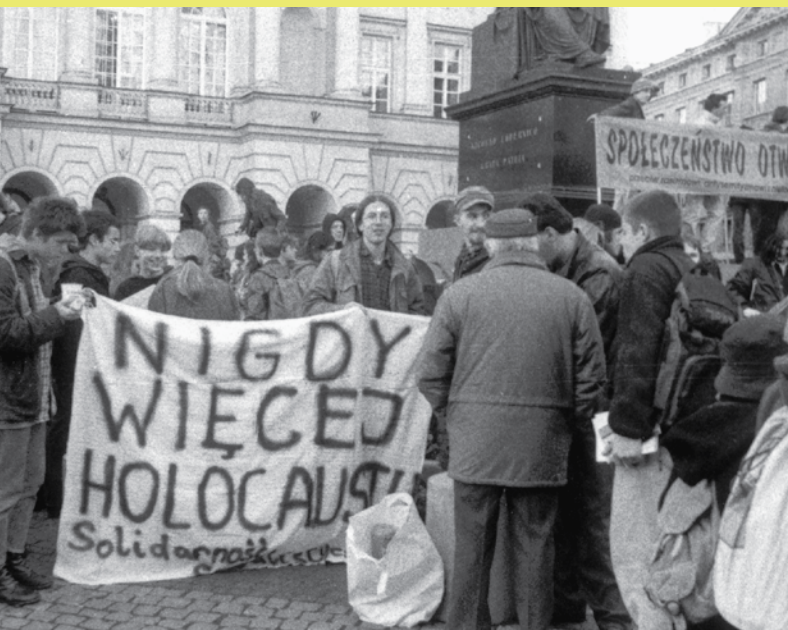
'Holokaust - nikad više'. Antifašističke demonstracije u Varšavi, 1996.