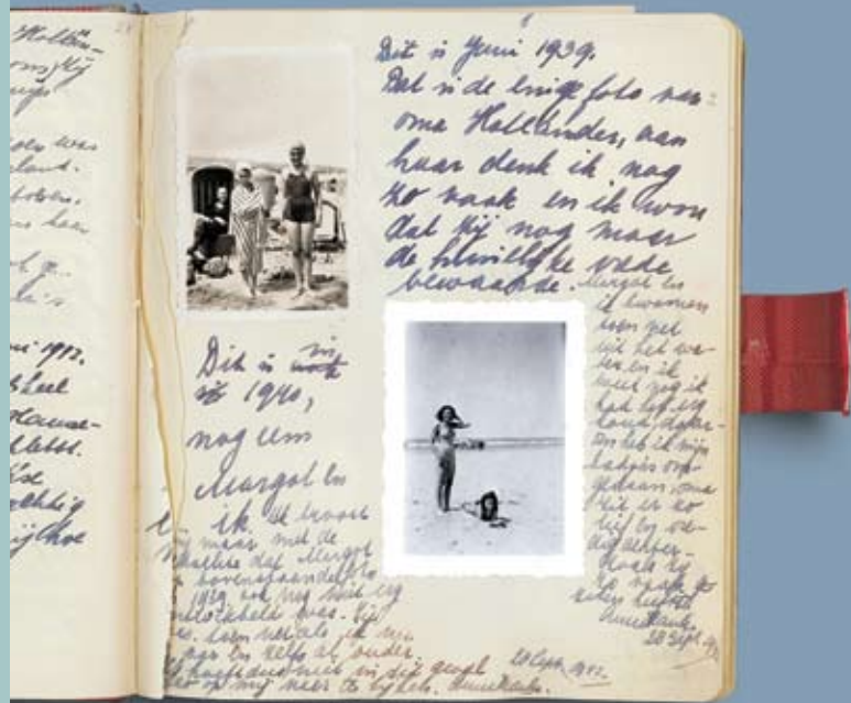
Dnevnik Ane Frank

Manji broj Židova koji su preživjeli rat, a nisu emigrirali, pokušao je izgraditi nov život u Europi. Zbog holokausta jedva da je ostalo nešto od tisuća židovskih četvrti u selima i gradovima diljem kontinenta. Tijekom godina neki su se aspekti židovske kulture polako vratili; posebne pekarnice i restorani, tu i tamo pokoja sinagoga. U isto vrijeme Europljani su se susreli s novim izrazima antisemitizma. Nijekanje holokausta jedan je od njih. Drugi pak ne niječu postojanje holokausta, ali umanjuju njegovu važnost.