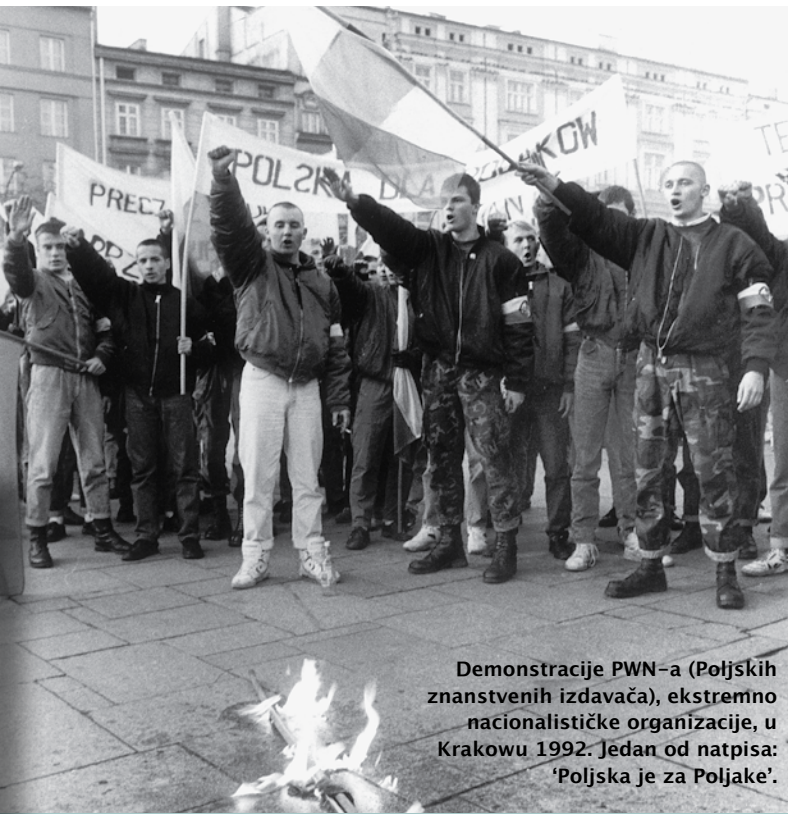
Demonstracije PWN-a (Poljskih znanstvenih izdavača), ekstremno nacionalističke organizacije, u Krakowu 1992. Jedan od natpisa: 'Poljska je za Poljake'.