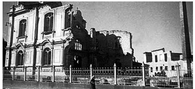
Lielās Horālās sinagogas drupas pēc Otrā pasaules kara. 1993. gadā to vietā atklāja memoriālu