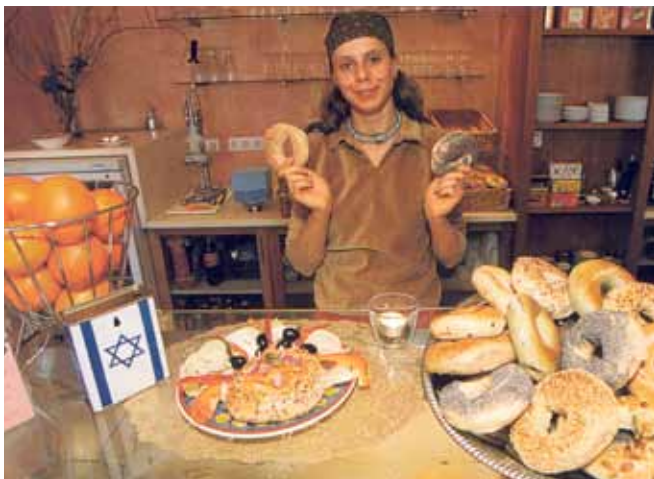
Ebreju beķereja Berlīnē.

Pēc holokausta beigām nacisma idejas neizzuda pavisam. Pat šobrīd Eiropā un ASV pastāv neonacistu grupas. Viņi, tāpat kā Hitlers, uzskata, ka "baltā rase" ir pārāka par citām. Viņi ir pret minoritātēm savās valstīs, tādējādi arī pret ebrejiem. Saskaņā ar neonacistu idejām paši ebreji bija tie, kuri izgudroja holokaustu. Viņi apgalvo, ka ebreji izgudroja Aušvici, lai gūtu atbalstu savas valsts izveidošanai. Viņi arī apgalvo, ka Annas Frankas dienasgrāmata nav īsta, bet tā tikusi sarakstīta pēc kara.