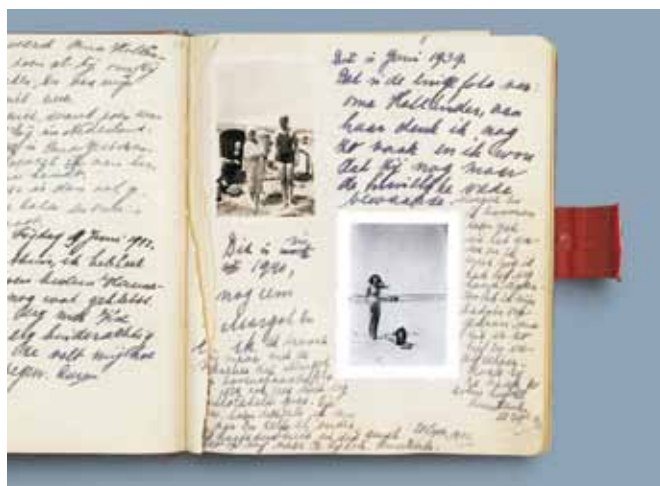
Annas Frankas dienasgrāmata.

Daži ebreji, kuri izdzīvoja karā un neemigrēja, mēģināja izveidot jaunu dzīvi Eiropā. Holokausta rezultātā gandrīz nekas nebija palicis pāri no tūkstošiem ebreju ciematu un pilsētu kvartāliem visā kontinentā. Gadu gaitā daži ebreju kultūras aspekti atgriezās, atvērās īpašas maiznīcas un restorāni, vairākās vietās tika atklātas sinagogas. Tajā pašā laikā eiropieši saskārās ar jaunām antisemitisma izpausmēm. Viens piemērs ir holokausta noliegšana. Savukārt citi nenoliedza, ka holokausts ir noticis, bet mazināja tā nozīmi.