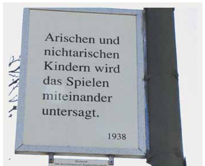
Projekta cīņai pret antisemitismu laikā Berlīnē izvietotie plakāti