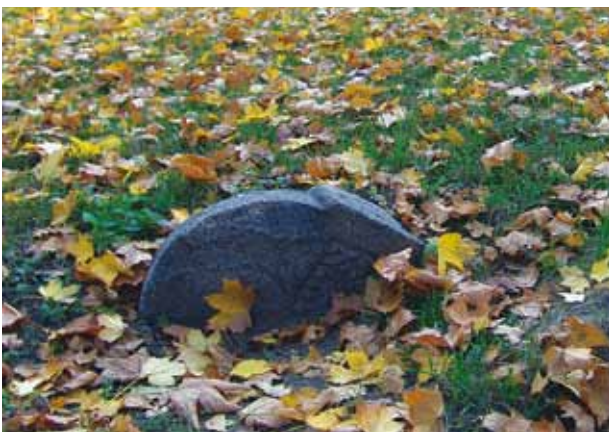
Kapakmens Rīgas vecajos ebreju kapos. Tos iznīcināja nacisti, bet padomju okupācijas laikā to vietā tika ierīkots parks.