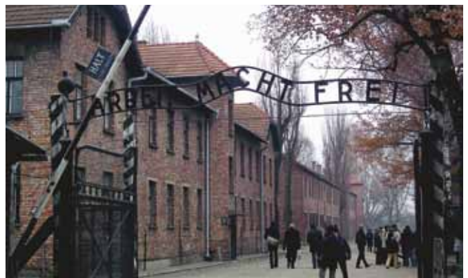
Aušvicas vārtu uzraksts "Arbeit macht frei" ("Darbs dara brīvu")