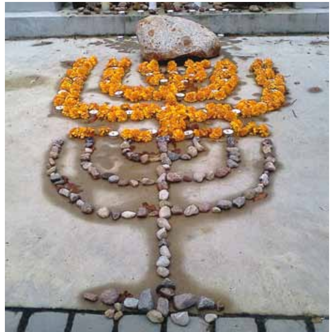
Holokausta piemiņas dienā Lietuvā 23. septembrī skolēnu izveidota piemiņas menora