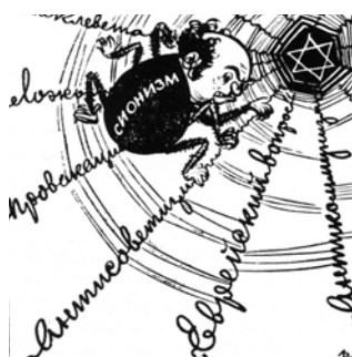
Tipiska pret Izraēlu vēsta karikatūra PSRS laikā.

Paskaidro, kāpēc Padomju Savienība un tās satelītvalstis mainīja savu nostāju pret Izraēlu 20. gadsimta 50. gados!