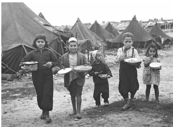
Ebreju bērni pēc ierašanās Izraēlā 1948. gadā.

Pirmie Eiropas cionisti apmetās Palestīnā pagājušā gadsimta sākumā, kad to pārvaldīja Lielbritānija. Sākotnēji ebreji dzīvoja mierīgi kopā ar palestīniešu – arābu kaimiņiem – un iegādājās zemi no arābu zemes īpašniekiem.