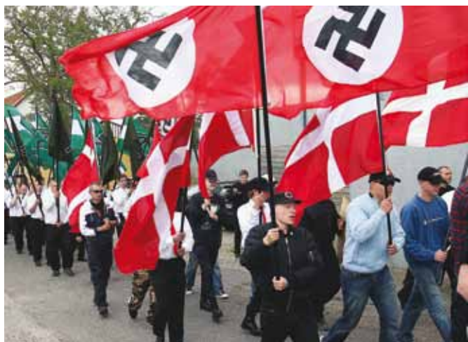
Neonacistu demonstrācija Dānijā 2007. gadā.