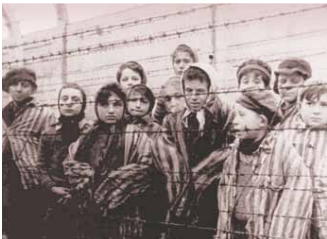
Pēc Aušvicas atbrīvošanas 1945. gada janvārī.

Pēc kara daļa ebreju vairs nevēlējās palikt Eiropā un atstāja to, dodoties uz ASV, Palestīnu vai citur.