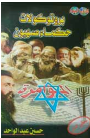
"Cionas gudro protokolu" arābu izdevums, 1976. gads.

Izraēlas konflikts bieži tiek izmantots kā iegansts, lai provocētu naidu pret ebrejiem, atjaunojot vecos stereotipus un aizspriedumus. Īpaši Tuvajos Austrumos ticība slepenam ebreju plānam, lai iegūtu pasaules varu, ir plaši izplatīta. Ebreju sazvērestības teorijas bija plaši izplatītas Eiropā un ASV, kad aptuveni 1900. gadā parādījās publikācija par "Cionas gudro protokoliem", kas tika uzskatīti par fiktīviem. Lai pārņemtu pasauli, antisemīti izgudroja rūpīgi pārdomātu un detaļās izstrādātu stāstu par ebreju sazvērestību. Neraugoties uz to, ka grāmata ir falsifikācija, "Cionas gudro protokoli" joprojām ir izplatīti galēji labējās aprindās, kā arī daudzās arābu un Āfrikas valstīs. 2006. gadā Irānas prezidenta paziņojums, kurā viņš noliedza holokaustu un pasludināja plānus par pilnīgu Izraēlas iznīcināšanu, šokēja pasauli. Tik atklāti izteikts valsts vadītāja antisemītisms bija jauns notikums, kas radīja plašus protestus visā pasaulē.