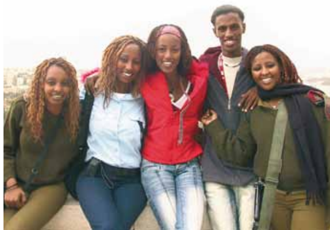
Izraēlas pilsoņi no Etiopijas.