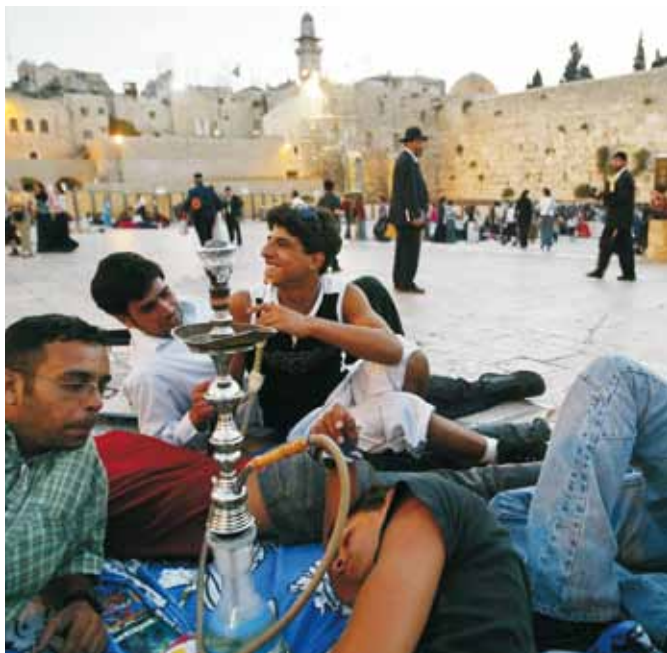
Izraēlas jaunieši pie Raudu mūra Jeruzalemē 2004. gadā.