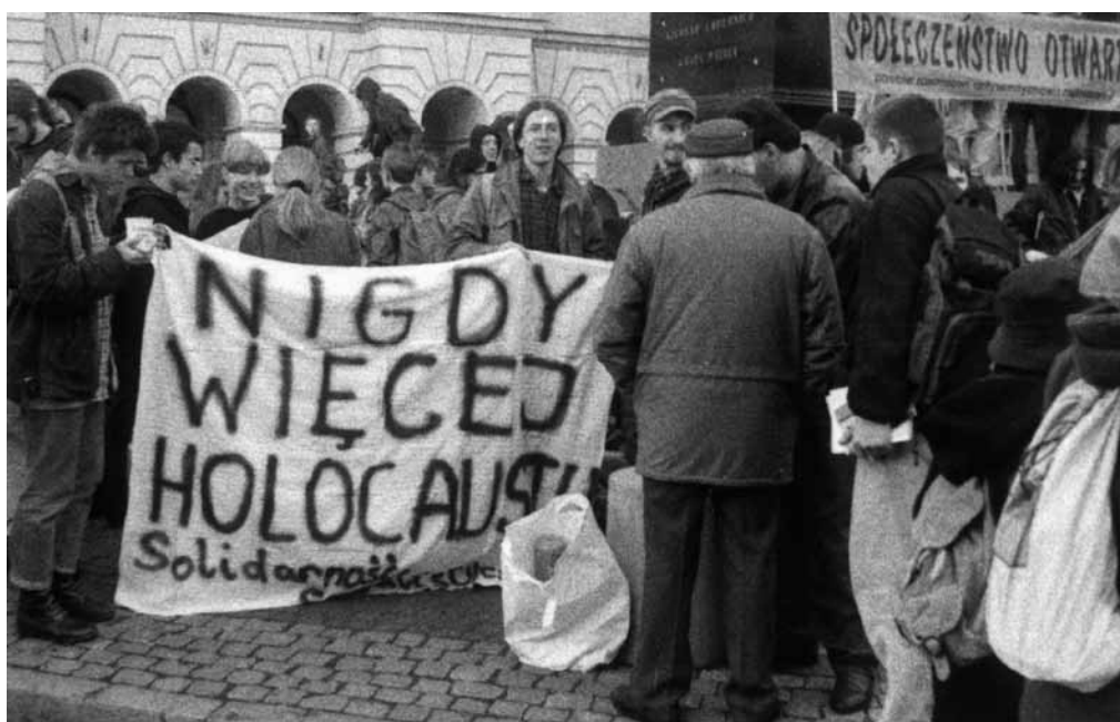
"Holokausts – nekad vairs". Antifašistiska demonstrācija Varšavā 1996. gadā.

1945. gadā 206 nacisti tika tiesāti Vācijas pilsētā Nirnbergā. Šī bija pirmā internacionālā tiesa pasaules vēsturē. Radās plāns par starptautiskas tiesas (tribunāla) izveidošanu, jo īpaši genocīda un noziegumu pret cilvēci lietu izskatīšanai. Taču plāna īstenošana tika kavēta ASV un Padomju Savienības savstarpējās spriedzes dēļ. Vīsa uzmanība bija pievērsta aukstajam karam. Tikai tad, kad 20. gadsimta 80. gados attiecības starp abām šīm valstīm uzlabojās, tika izveidoti pirmie tribunāli – Dienvidslāvijas tribunāls 1993. gadā un Ruandas tribunāls 1994. gadā. Tajā pašā laikā pastāv arī Starptautiskā Krimināltiesā Hāgā, Nīderlandē. Tomēr dažas valstis, piemēram, ASV, Izraēla, Ķīna, Irāna un Ziemeļkoreja šo starptautisko tiesu neatzīst.