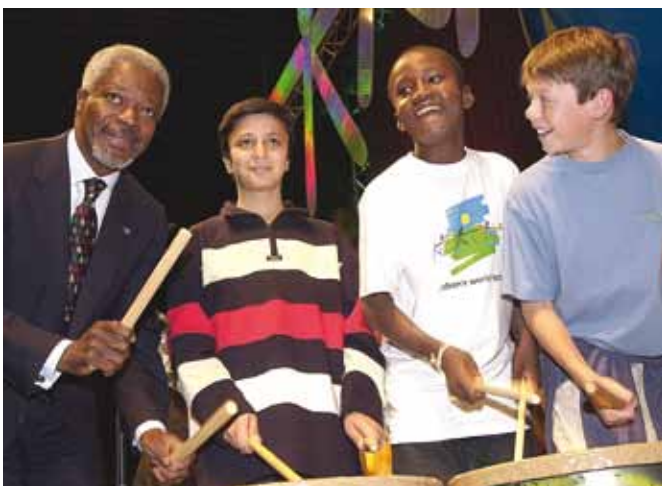
Kofi Anans, ANO ģenerālsekretārs līdz 2006. gadam, Pasaules bērnu festivālā 2000. gadā Bāzelē, Šveicē. "Ja jūs cīnāties pret antisemitismu, jūs vienlaikus cīnāties par cilvēces nākotni."