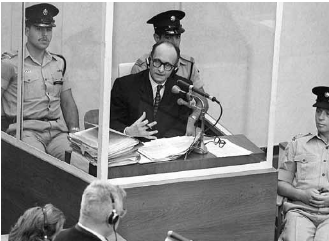
Eihmanis tiesas zālē Jeruzalemē 1961. gadā.

Tas bija tikai 1961. gadā, kad Ādolfa Eihmaņa tiesas prāvas rezultātā daudzi cilvēki beidzot uzzināja par holokausta milzīgajiem apmēriem un visu to, kas bija noticis ar ebrejiem Otrā pasaules kara laikā. Eihmanis bija atbildīgs par ebreju transportēšanu no nacistu okupētajām valstīm uz koncentrācijas un nāves nometnēm. Eihmaņa tiesas prāva bija īpaša. Skatus no tiesas prāvas cilvēki varēja aplūkot, neizejot no savām mājām, izmantojot nesenu radušās televīzijas iespējas. Tiesā liecināja holokausta upuri. Katrs varēja redzēt, cik emocionāla bija publika, un visi bija liecinieki Eihmaņa paskaidrojumam, ka viņš vienkārši esot pildījis pavēles. Tas bija šokējošs paziņojums, jo īpaši tāpēc, ka kļuva skaidrs, cik daudz palīdzības saņēma nacisti ebreju vajāšanai no cilvēkiem, kuri vienkārši pildīja "savus pienākumus".