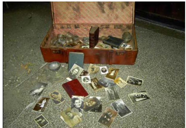
Овај кофер су као пројекат Дана сећања на Холокауст начинили студенти Клуба Сећања, Влаицу Вода националног колеџа, Румунија, октобар 2004.