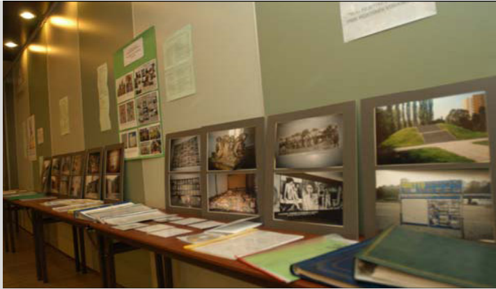
Изложба студентског пројекта, „жива историја литванских јевреја“ на Национални дан обележавања холокауста, 23. Септембар 2004.