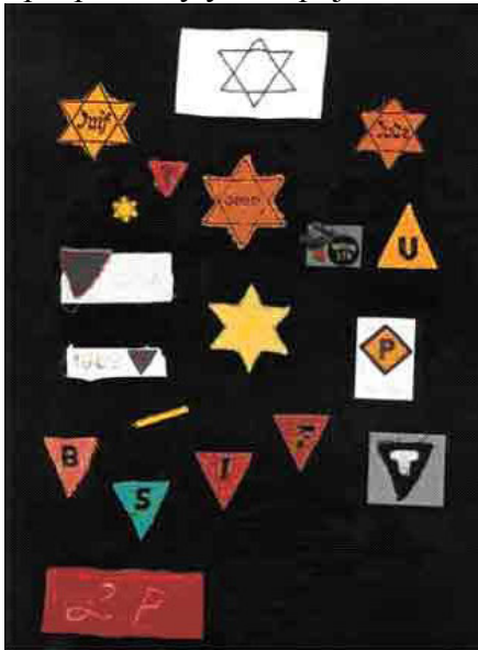
Фотографија која приказује идентификационе беџеве и траке за руке које су носиле пазличите групе жртава Национал-Социјалиста, укључујући јевреје, Јеховине сведоке, Роме и криминалце. Такође садржи траку за руку полицајца кампа. Беџеви и траке за руке су преузети из колекције Музеја Холокауста у САД.

Националсоцијалистичка Немачка је организовала систематски, бирократски организован механизам за масовно уништење европског јеврејства. Њена убилачка машинерија, која не само да је убила милионе, него и употребила њихове телесне остатке у индустријске сврхе, означила је прекретницу у историји човечанства.