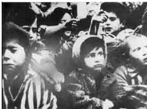
Деца у логору, дижу руке у време ослобађања, Аушвиц, Пољска