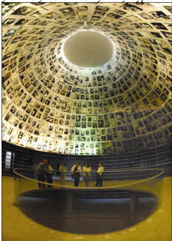
Дворана Имена, део Новог Музеја Историје Холокауста у Јад Вашему. Испуњавајући своју улогу у чувању индивидуалности сваке појединачне јеврејске жртве убијене од стране Национал-Социјалиста и њихових сарадника, Јад Вашем сакупља „Странице сведочанстава“, још од средине 50их година. Њих достављају преживели, рођаци или пријатељи жртава, и тиме су ове Странице Сведочанстава сачувале трајном успомену у Дворани Имена у Јад Вашему.

Стављање нагласка на лица, имена и свакодневни живот жртава холокауста враћа достојанство свима који су убијени. Представљањем жртава као људских бића из дуго установљених заједница, радије него као статистичких података из плинских комора и масовних гробница, наставници могу ученике упознати са мултикултуралном таписеријом живота Јевреја у Европи између два рата.