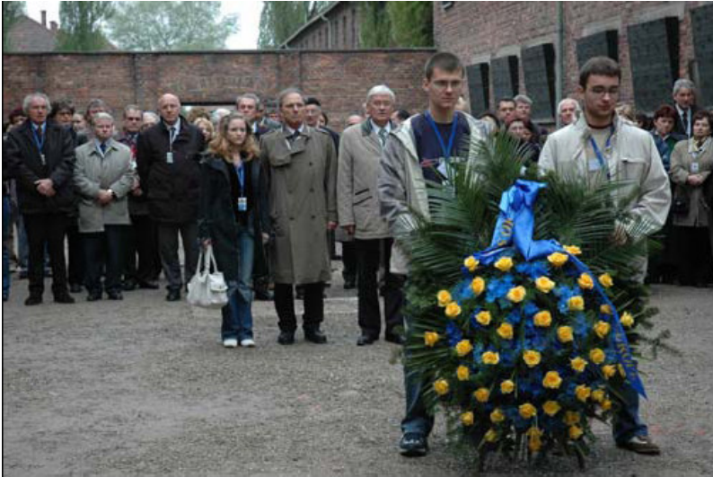
Полагање венца на Зид смрти на дворишту Блока 11 у Аушвицу I-Stammlager. Омладинске делегације и Министри образовања 48 држава чланица Европске Културне Конвенције учествовали су у интернационалном семинару „Подучавати о сећању кроз културно наслеђе“, одржаног у Кракову и Аушвиц- Биркенау, Пољска, 4-6. маја 2005.

У октобру 2002. министри образовања чланица Већа Европе донели су резолуцију по којој Дан сећања на холокауст треба установити у свим школама земаља чланица. 1 Након тога, у новембру 2005, Уједињене нације на шездесетој пленарној генералној скупштини, одлучују да међународни дан сећања у част жртава холокауста буде 27. јануар, и подстичу земље чланице да разраде образовне програме које ће сећања на ову трагедију пренети новим поколењима. 2