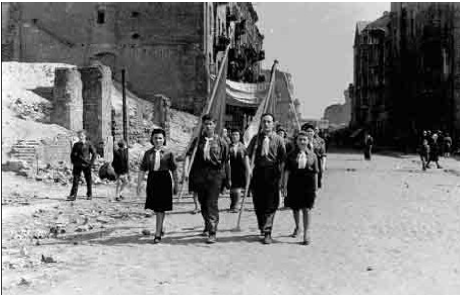
Варшава, Пољска, послератни период, Меморијални марш посвећен жртвама холокауста. (Јад Вашем)

Дани сећања на холокауст су у неким земљама релативно нова појава, док су у другим већ дугогодишња традиција. Владе су подстакле и организовале службене свечаности и посебне парламентарне седнице обележавајући Дан сећања на холокауст, а све су пропратили локални, национални и међународни медији.