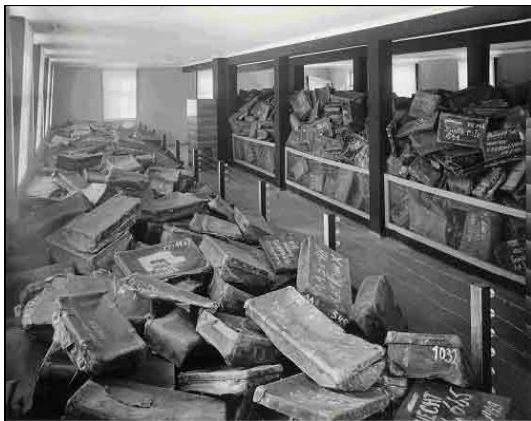
Аушвиц, Пољска, послератни период, кофери у Музеју.

У Норвешкој, Директорат за основне и средње школе подстиче све школе на обележавање Дана сећања на холокауст и даје образовне изворе на својим веб страницама. Многе школе организују рецитале поезије и изложбе, док друге организују процесије са бакљама и позивају преживеле и сведоке да испричају своје личне приче.