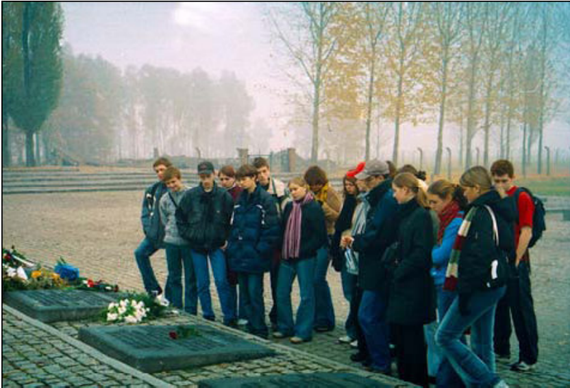
Полагања венца у меморијал Биркенау, 27 Октобар 2004, Руски средњошколци из Москве који учествују на семинару „Аушвиц-Историја и Символизам“ који организује едукативни центар Аушвиц Биркенау државни музеј.