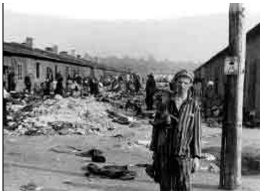
Некадашњи затвореник, логор Берген Белсен у Немачкој

На овај дан наставници могу организовати сусрете ученика са сведоцима (нарочито преживелим жртвама холокауста, али и са ослободиоцима и спасиоцима) који се сећају својих искустава из Другог светског рата. Свједочења уживо могу бити веома снажног утицаја и могу допринети дубљем саживљавању ученика. Затим, раније снимљена визуелна историјска сведочења такође могу бити подстицајно наставно средство. Наставници се могу фокусирати на оно што су ученици сазнали из сведочења преживелих и на утиске које су на њих та сведочења оставила.