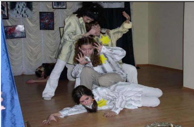
Изведба плесне групе Zarogozhуе JCC као део Маратона пројекта сећања у Украјини 2005, Ткума (Централна Украјинска Фондација Холокауста)

Централна украјинска фондација за холокауст "Ткума" је 27. јануара 2005. организовала пројекат познат као "Маратон сећања", с циљем да подигне свест о холокаусту у десетинама украјинских градова и места. Догађаји су укључивали наградну свечаност за студенте који су учествовали у такмичењима о холокаусту, "Маршеве живих" на аутентична места страдања жртава холокауста, округле столове студената са познатим особама и конференцију за штампу са представницима међународних и локалних медија везану за шездесетогодишњицу ослобођења Аушвиц-Биркенауа. У Одеси је комеморацију обележила комбинација литерарних и уметничких слика и прича Ели Визел, преживеле жртве холокауста и добитнице Нобелове награде. Државни и локални званичници такође су учествовали у тим догађајима.